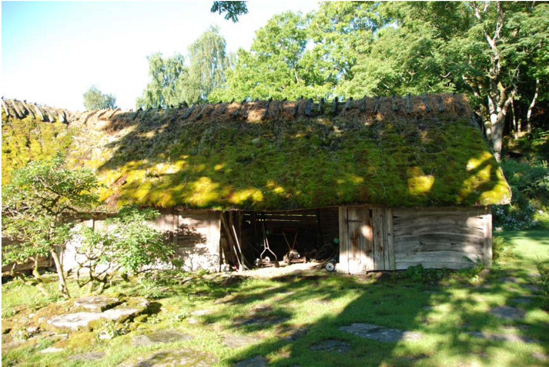
Ny ryggning på västra länkan.