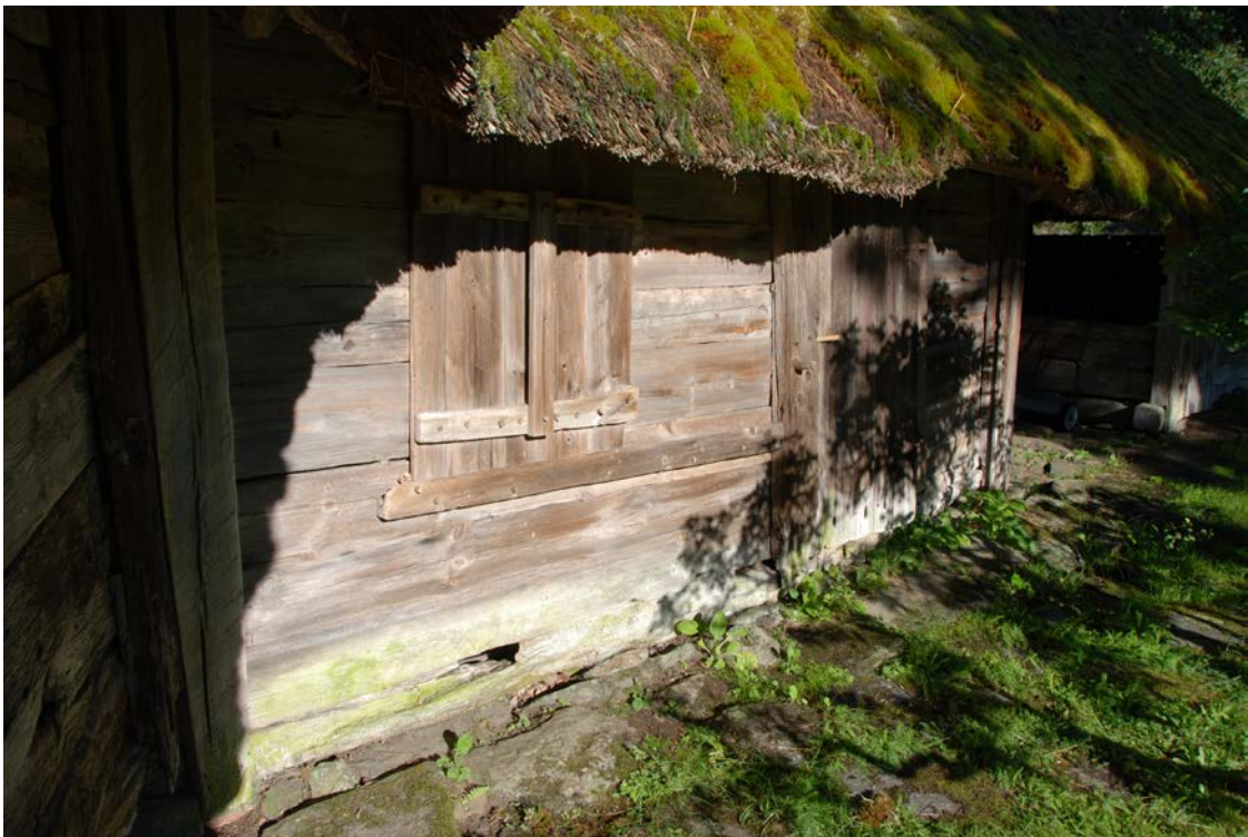
På insidan av den västra längan har dragluckan justerats och luckan till höger om den har fått en ny stoppinne.