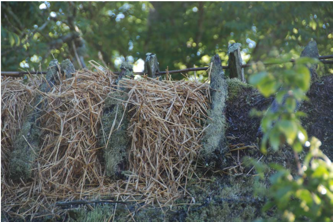
Käpparna som håller pollarna var generellt sett i väldigt dåligt skick och har bytts ut mot nya, av hassel.