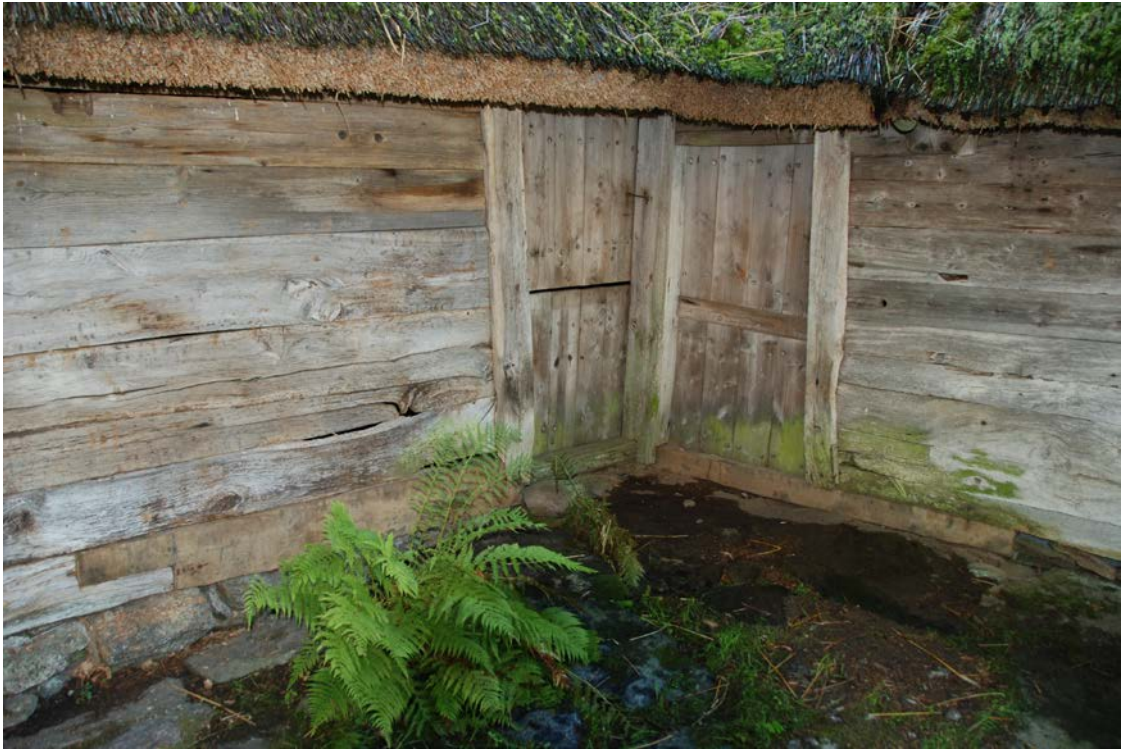
Iordningsatt skiftesverk och utbytta delar samt upplyfta stenar, i innerhörnet mellan östra och södra längan.