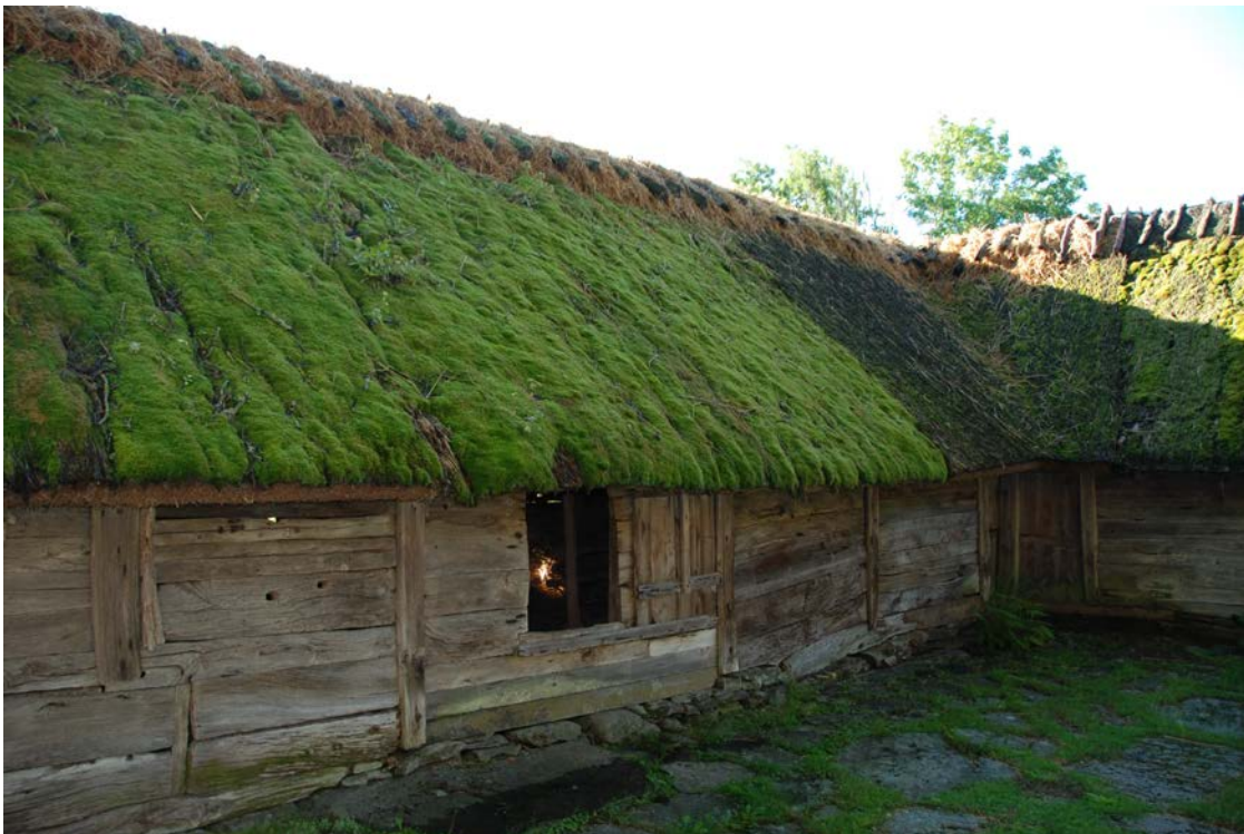
Ny ryggning av halm på östra längan.