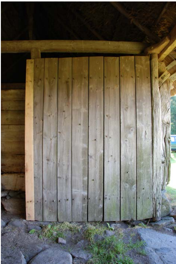
Bytt del i port.