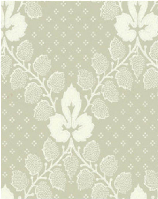
Tapetförslag till kammare, "Gudmundstjärn" från Lim och handtryck i färgerna grön/vit.