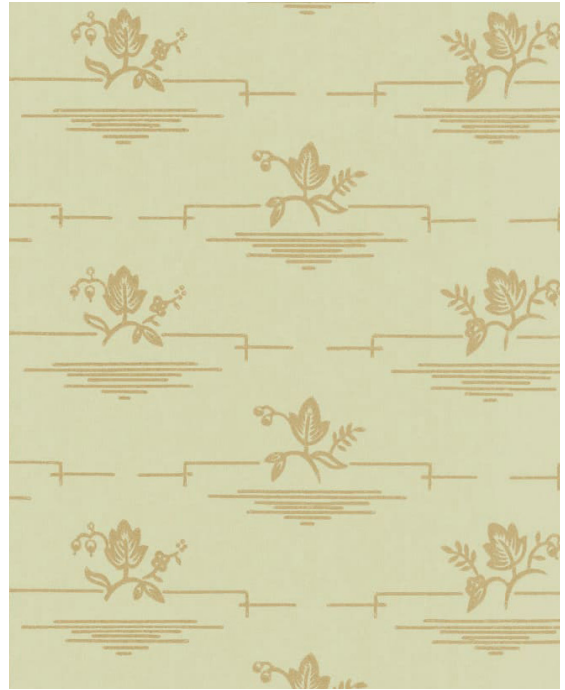
Tapetförslag till förstuga, "Deco" från Lim- och handtryck i färgerna grön/guld.