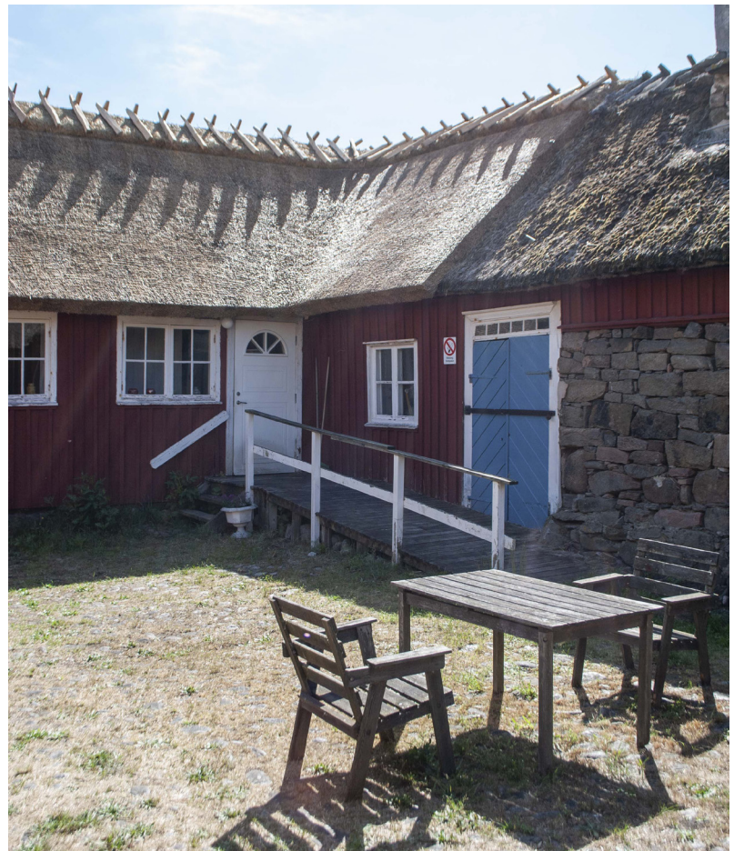
Hörnet mellan östra och södra längan mot gården. En liten bit av den södra längans tak har också bytts då de största skadorna på ett stråtak oftast uppstår i hörn.