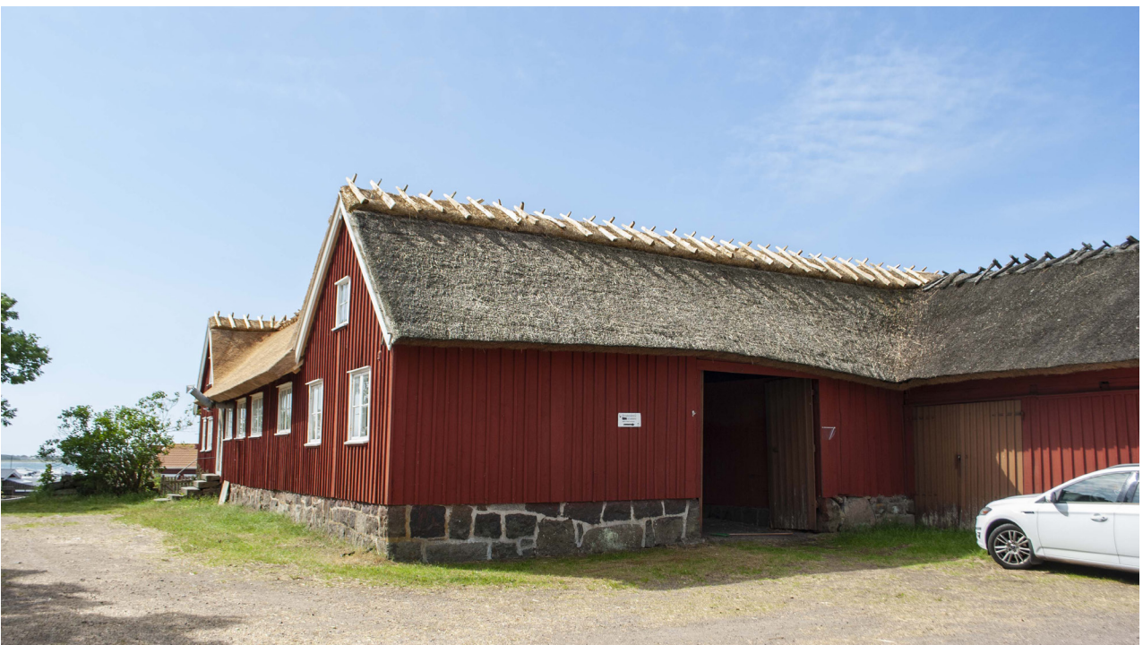
Den nya ryggingen syns även mot norr, på den norra längan.