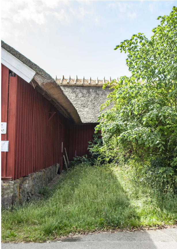
Norra längan mot norr, med ny ryggnig. Denna del av gården har relativt ny taktäckning från 2014.