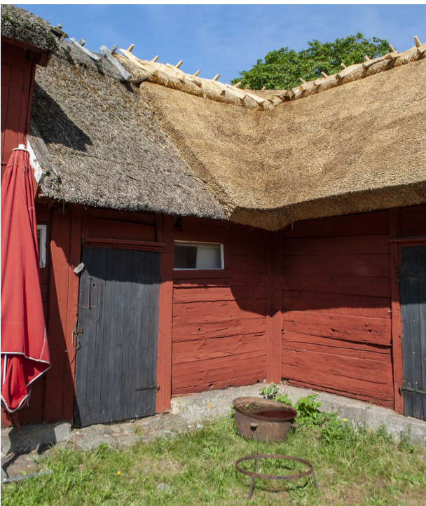
Ovan: Hörnet mellan norra och östra längan. Det är här tydligt hur mycket det befintliga taket sjunkit ihop. Till höger: Enstaka taksparrar har kompletterats.