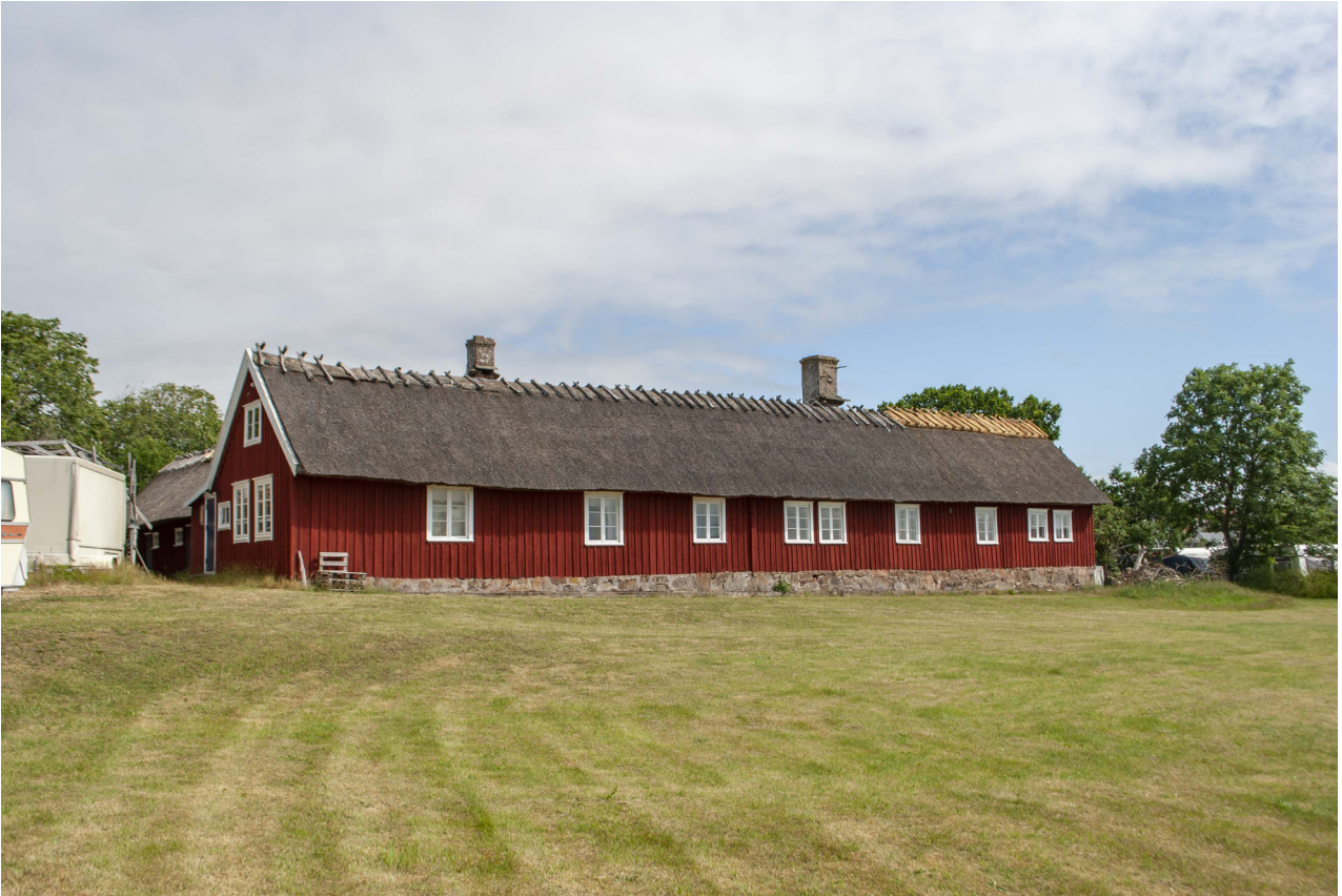
Alla takfall som lagts om har också fått ny rygging, vilket också syns mot motsvarande takfall som inte lagts om, här den södra längan.