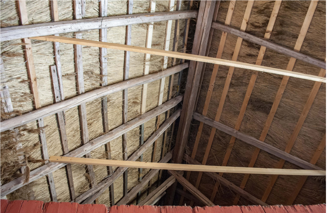
Ett fåtal läkt har bytts i taket i norra längan, till vänster i bild.