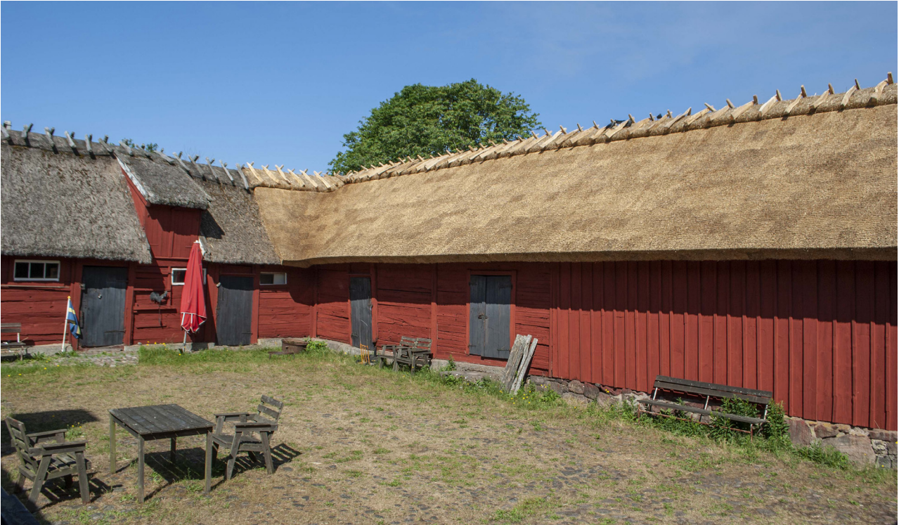
Norra längan mot gården med nytt tak. Även hörnet mot västra längan har lagts om.