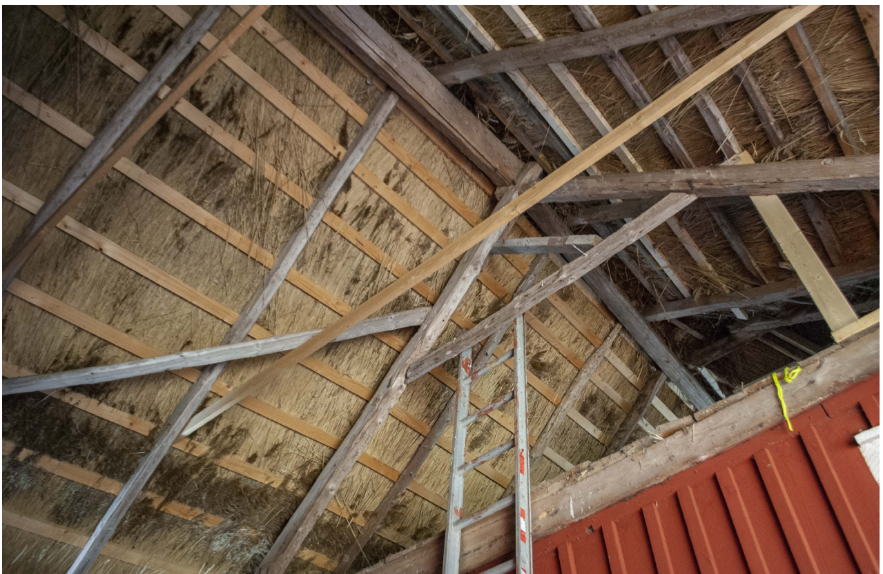
Några läkt har bytts i taket över porten, närmast taknocken.