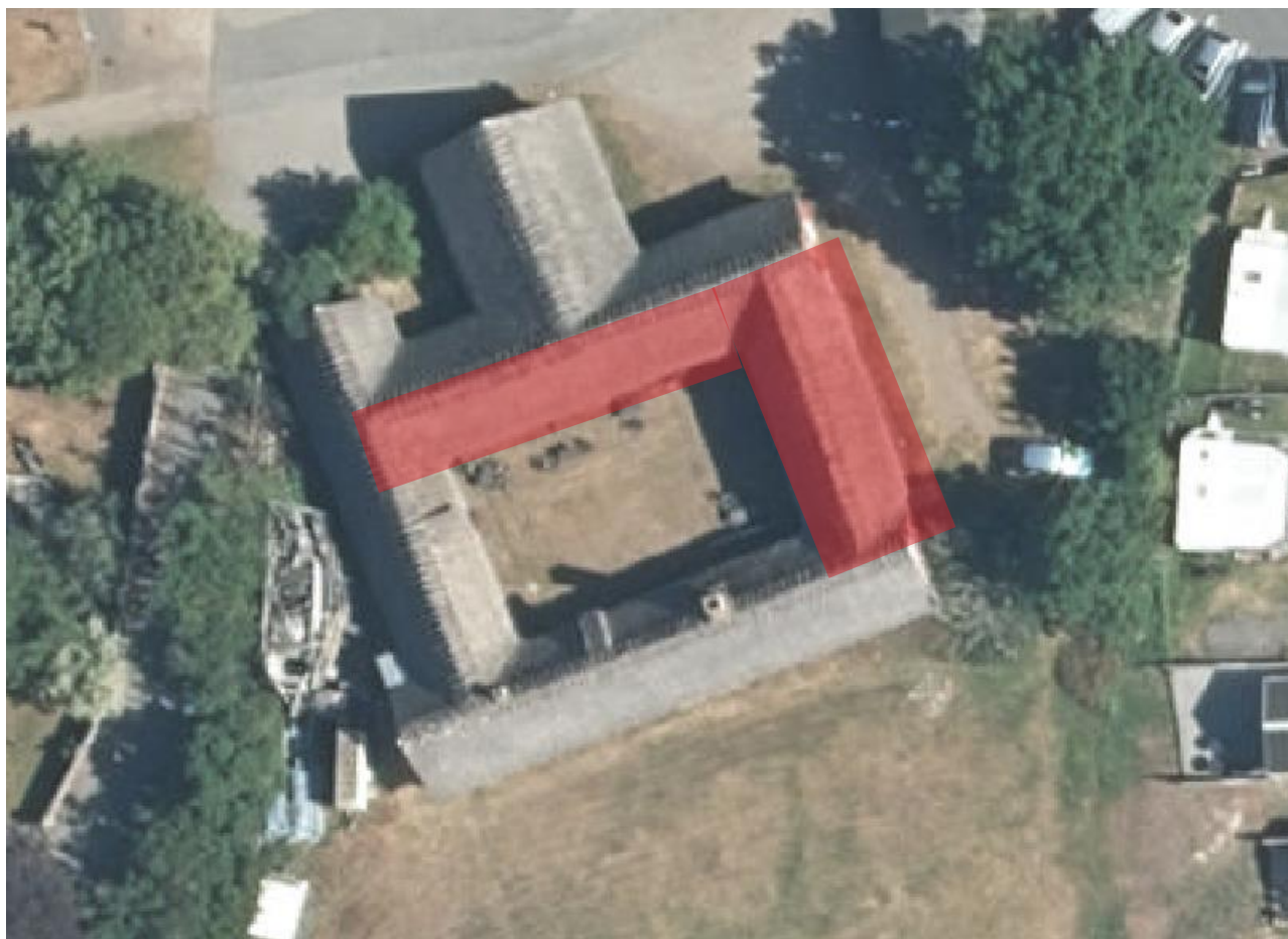
Takfall som lagts om med ny vass och ryggnig.