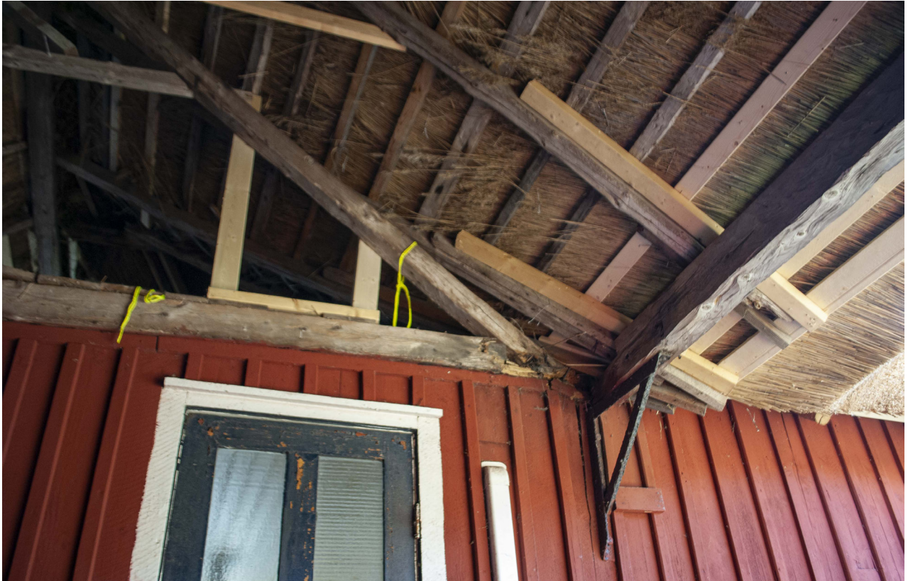
Det rötskadade hörnet av takstolen över porten har stöttats upp provisoriskt för att säkerställa stabiliteten.