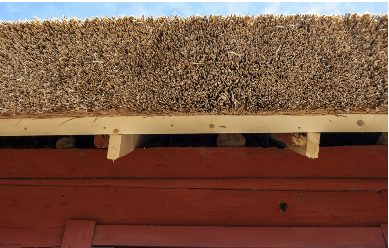
Några taksparrar har kompletterats i takfallet mot gården på den norra längan.