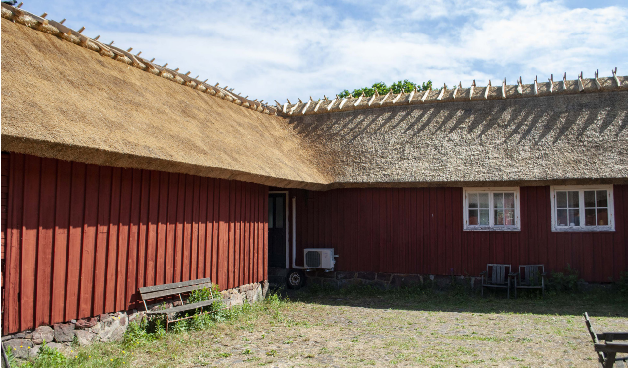
Hörnet mellan norra och östra längan mot gården.