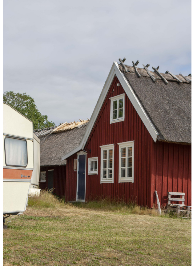
En liten bit av den västra längan har också ny ryggnig.