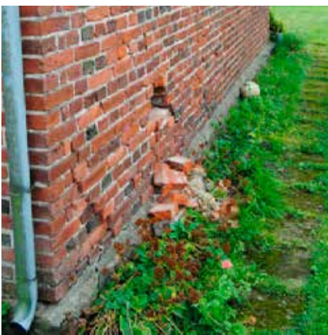
Vy från nordväst

Nedan t.h: Grundmuren av marksten är endast bitvis synlig.