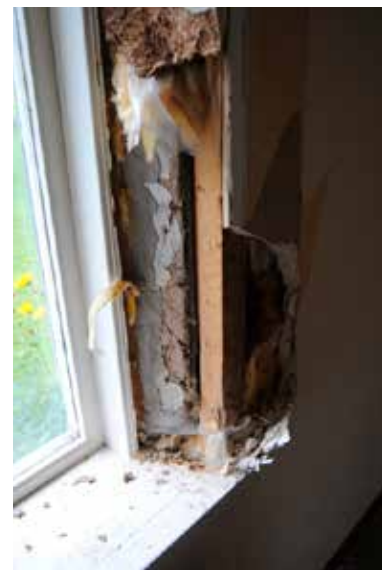
Väggarna har isolerats invändigt och klätts med gips.