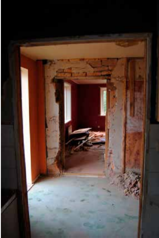
Vy från köket mot entréhallen.