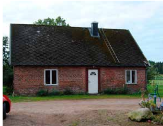
Norra fasaden. Nedan vy från trädgårdssidan.

Byggnaden står på en låg grundmur av marksten och är däröver uppförd i en våning med väggar av rött handslaget tegel. Gavelröstena är klädda med rödfärgad locklistpanel och taket är täckt med eternitplattor i rutmönster. Fönstren består av vitmålade tvåluftsfönster utan spröjs. Mitt på fasaden sitter en modern entrédörr i vitt kompositmaterial. Fasaden uppvisar flera skador där murbruk och tegel vittrat sönder.