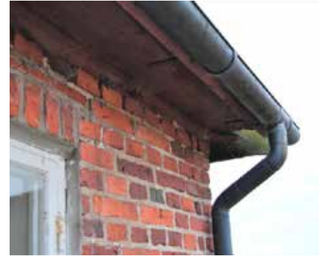
Detalj av takfot.