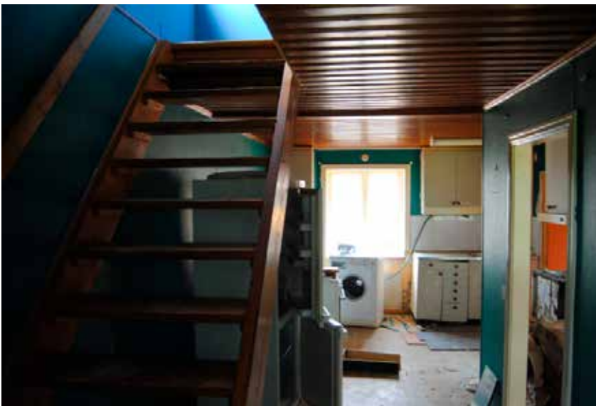
Trappa upp till vinden. T.h. köket.