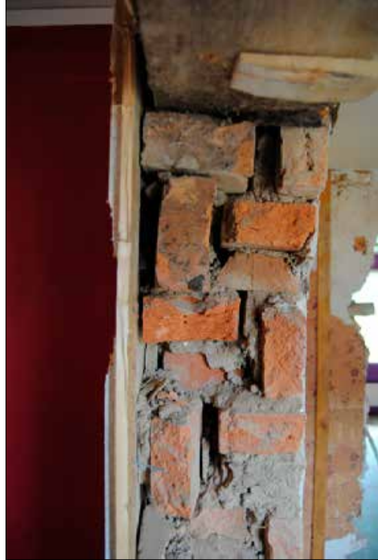
Tegelstenarna är delvis murad stående. Murbuket har här tappat bindningsförmåga och stenarna hänger löst.