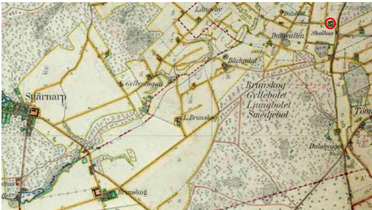
Utdrag från Häradsekonomiska kartan 1919-25 med gården Odlingen inringad.

Manbyggnadens ålder är ej fastställd men troligen är den från andra halvan av 1800-talet. Enligt en uppgift ska den vara uppförd på 1880-talet. Liksom flera av Stjärnarps arrendegårdar uppfördes det i tegel från godsets egna tegelbruk.