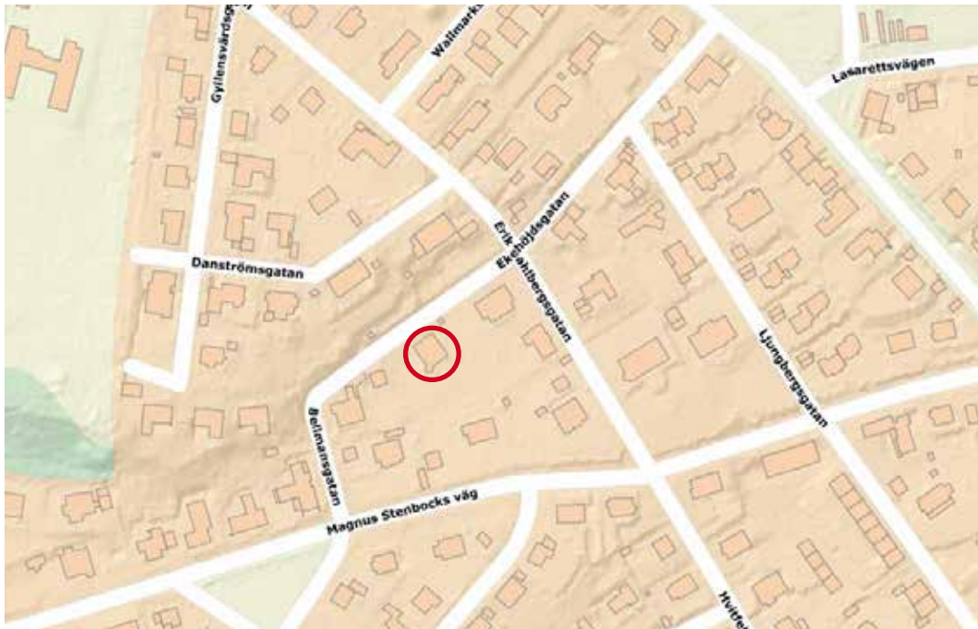
Den röda ringen markerar den aktuella bebyggelsen. Karta: Halmstad kommun

Fastighetsägaren har ansökt om bygglov för igen-sättning av källardörr mot nordväst och upptagning av ny dörröppning mot sydöst. I ansökan ingår även förändring av marknivån och anordning av uteplats vid fasaden i sydöst.