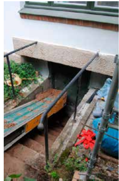
Nuvarande källartrappa med smidesräcken och källardörr. Smidesräckena bör återanvändas.