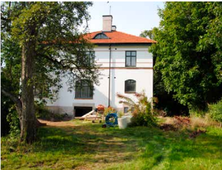
Vy från trädgården mot sydöstra fasaden.