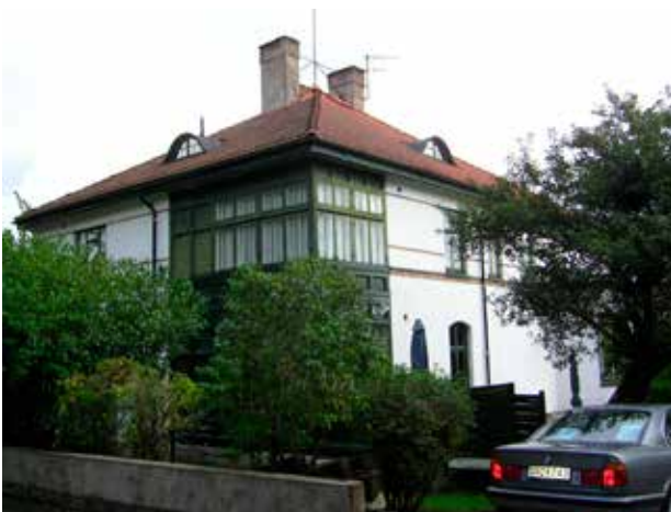
Excellensen 2, februari 2007,

Byggnaden är värderad som klass A i bebyggelseinventeringen 2006-07. Klassningen innebär att byggnaden har ett mycket högt kulturhistoriskt värde, av "byggnadsminnesklass".