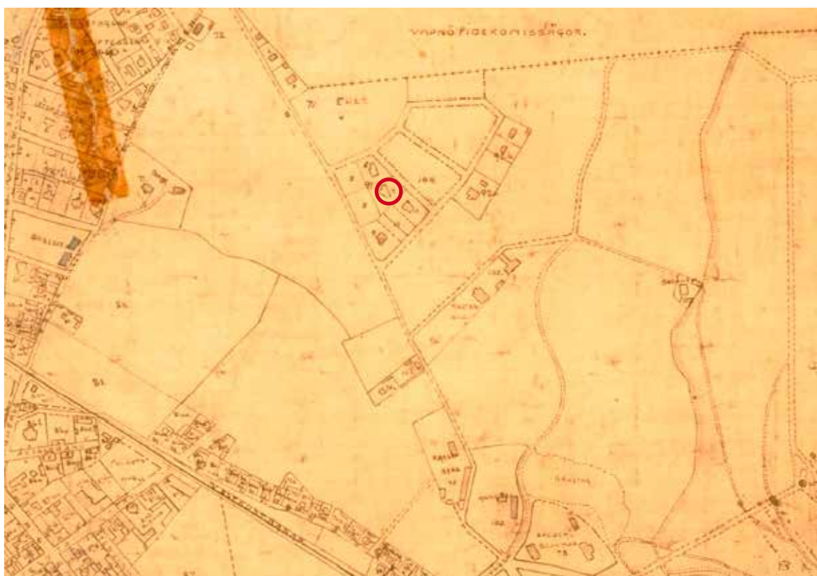
Excellensen 2 inringad på en karta från ca 1910.