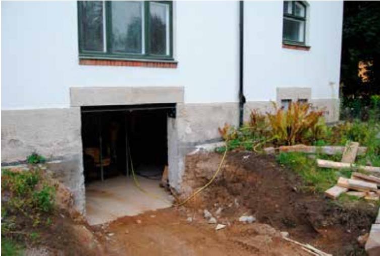
I den nya öppningen mot sydost har tidigare suttit källarfönster. Dessa bör användas till öppningen som sätts igen i fasaden i nordväst.