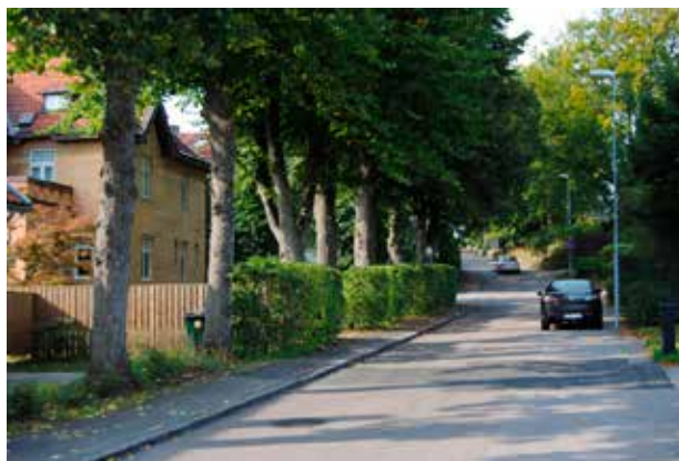
Erik Dahlbergsgatan med kv Excellensen t.v.

Bostadshuset på Excellensen 2 är ett tvåvåningshus med släpudsade och vitmålade fasader med dekorativa, horisontella band av rött tegel. Fasadmaterial avviket vid entrén nordväst där hörnet är utfört av grönmålad träpanel, såsom en inbyggd veranda i två våningar. Husets södra hörn utgörs av en cirkelrund utbyggnad med balkong. Taket har tälttakets form och är täckt med falsat flackt tegel. Fönstren består av främst av korspostfönster av olika slag med fyra och åtta lugter. Fönster liksom dörrar har välvd överdel på bottenvåningen och rak överdel på övervåningen. Grund och källare markeras av en ca 50 cm hög spritputsad sockel. Källarfönster och källardörr har rak överdel och markeras av horisontella, rektangulära fält.