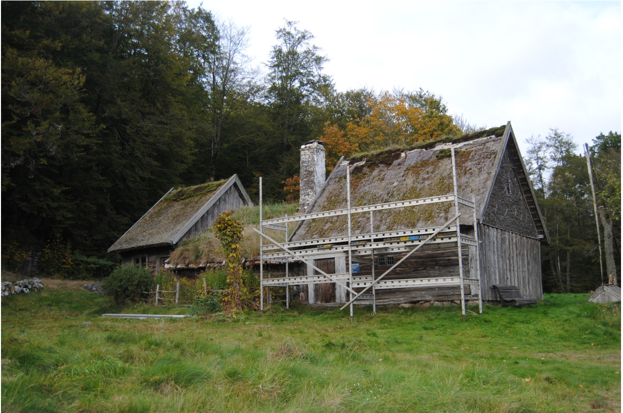
Torpet före takreoveringen påbörjades.