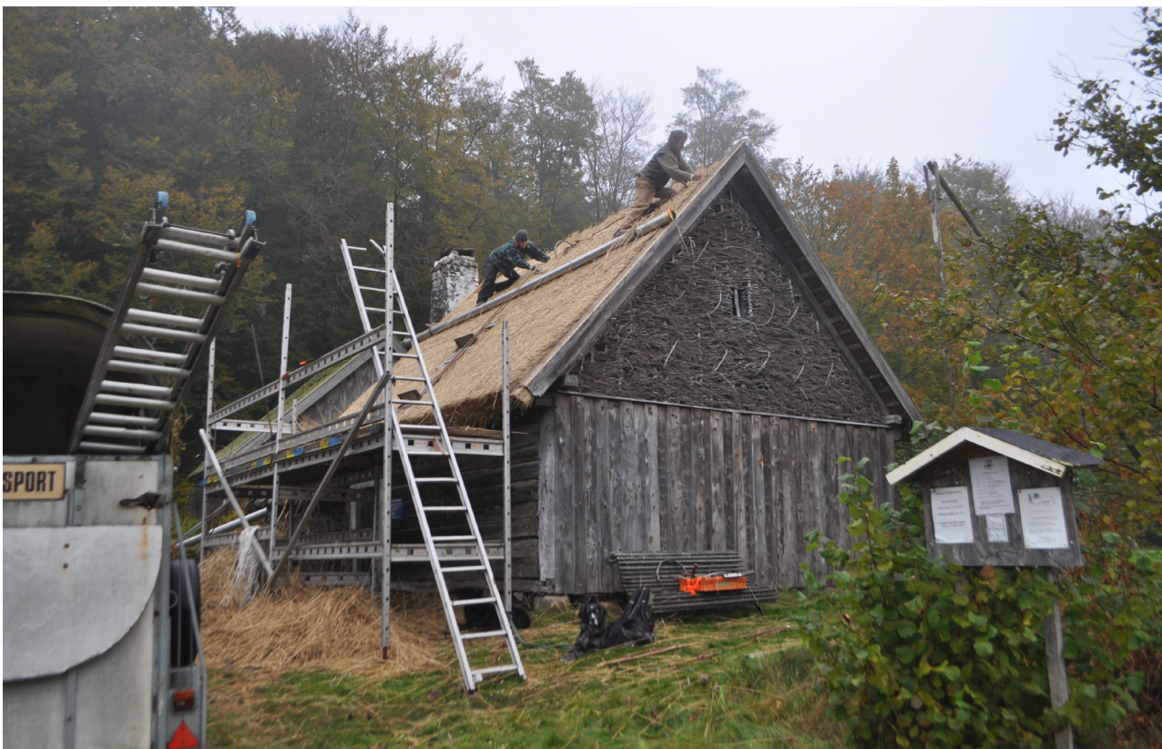
Taktäckarna jämnar till takfallets övre del. Efter att takfallet är lagt täcksnocken med ryggning av grästorv hämtad i närheten av torpet.