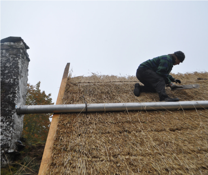
Ovan: Taktäckningen utförs. Taktäckaren jämnar ut halmen med en s.k. täckevraga. Till höger syns takfoten underifrån och de läkt som halmen vilar mot. Dessa var i gott skick och behövde inte bytas ut.