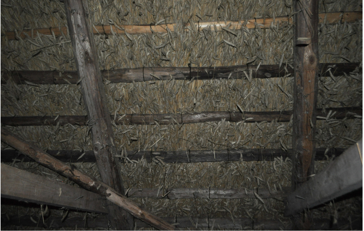
Halmtaket sett från insidan av byggnaden. Halmen ligger på öppen läkt.