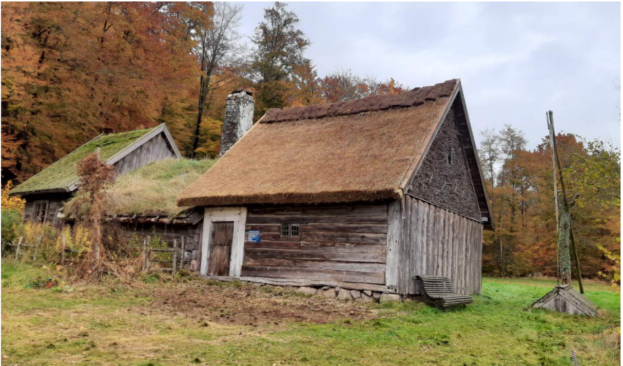
Takfallet efter slutförd taktäckning där även ryggingen av torv lagts på plats.