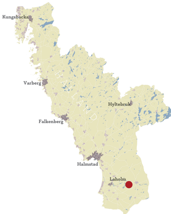
Den röda ringen markerar fastigheten. Karta: Laholms kommun