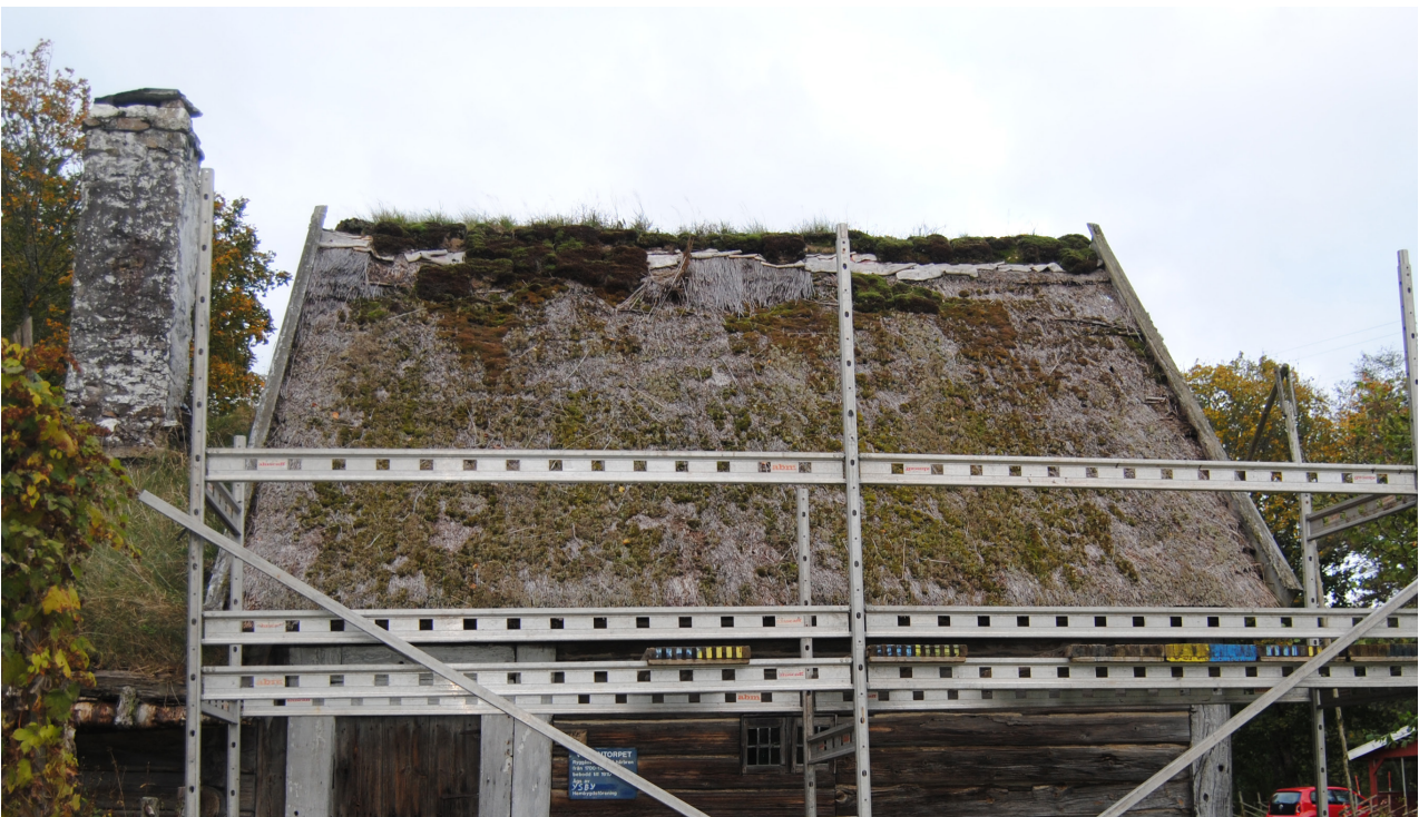
Takhalmen har tunnats ut och taket är mossbevuxet. Delar av ryggingen saknas. Notera björknävern som ligger som tätskikt under torven.