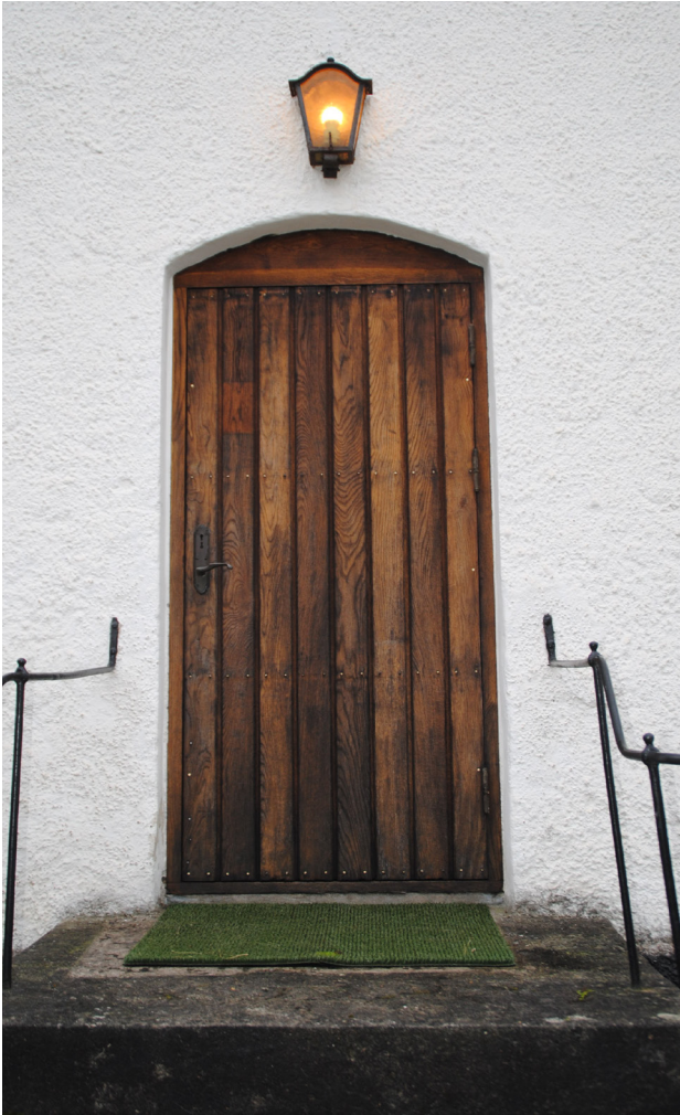
Ekdörren på sakristian i norr var i bättre skick än huvudentrén i väster.