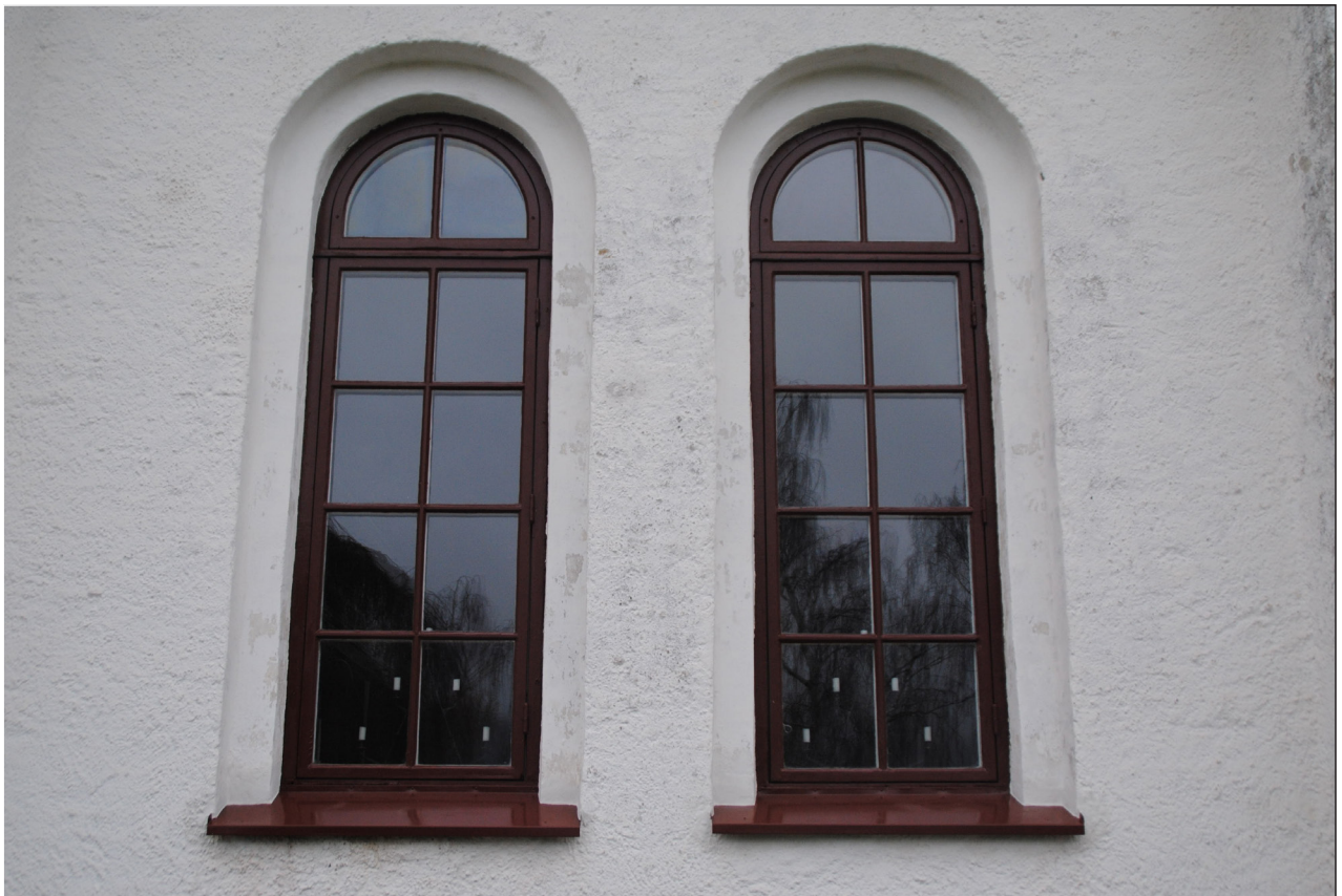
Nedan: Två av fönstren på södersidan efter ommålning.