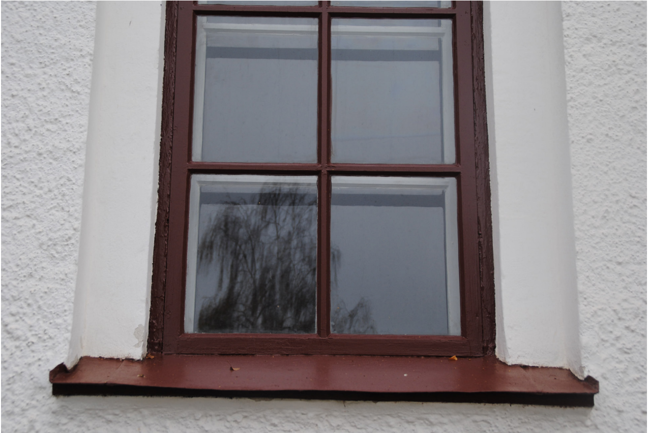
Ett av norra sidans fönster nedtill efter ommålning. På norra sidan finns de gamla fönsterblecken kvar.