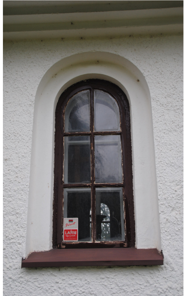
Fönstren på sakristian hade en del färgsläpp och kittningen behövde kompletteras. Fönstren renoverades på plats.