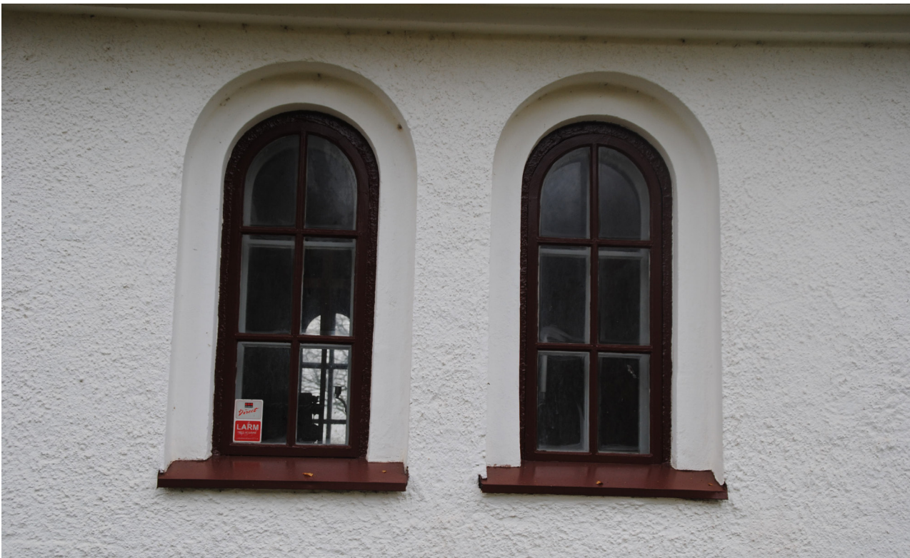
Sakristians fönster efter ommålning. Även på sakristian finns de äldre fönsterblecken kvar.