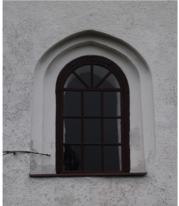
Ovan: Tornfönstret på södersidan efter ommålning.

Södra sidans dubbelkopplade fönster var i behov ommålning runt om. Färgskiktet flagade och satt mycket löst. Samtliga bågar har monterats ner och transporterats till Bröderna Bergströms verkstad i Halmstad för renovering på samtliga sidor. Karmarna har renoverats runt om på plats i kyrkan. Södra sidans fönsterbågar och karmar har på samtliga sidor rengjorts från all färg, uppskrapats och slipats (rengöringsgrad 1). Fönstren har grundats och målats om med linoljefärg. Fönsterblecken på samtliga fönster, utom tornfönstret, har bytts till nya med bättre anslutning mot karm och puts och med droppnäsa. Fönsterblecken är utförda med förbehandlad galvaniserad plåt som platsmålad med samma linoljefärg och kulör som fönstren.