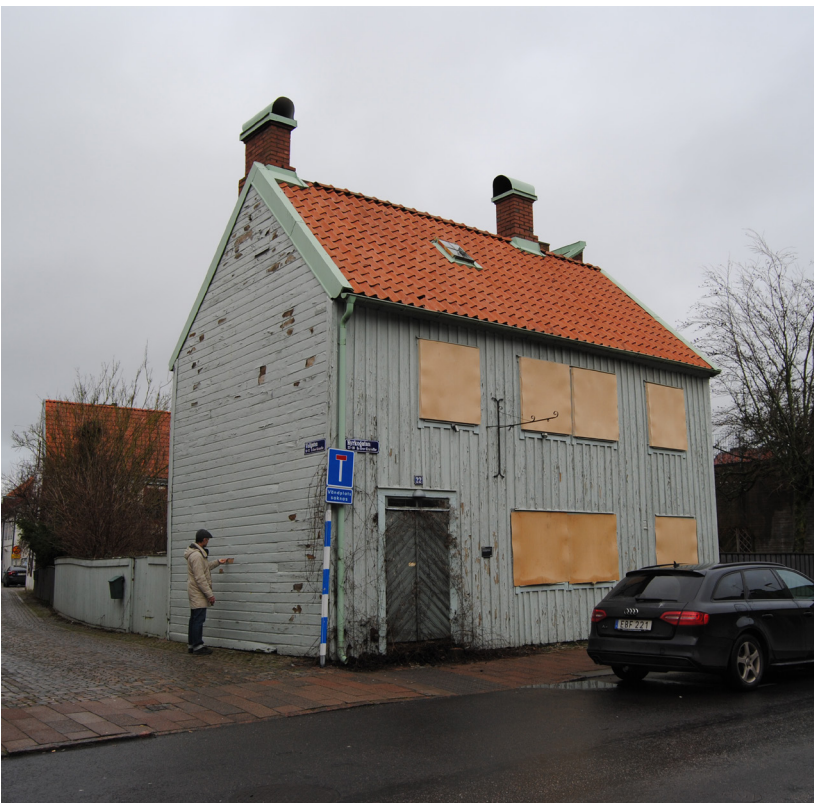
Överst t.v: Byggnadens norra fasad, mot innergården. Här syns det utanpåliggande entrépartiet med trappa.