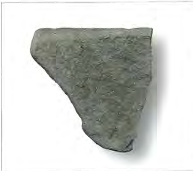
Fig. 1. Det skivformade redskapet, tillverkat av sandsten.

Vad kan då de här två till synes oansenliga stenföremålen ha haft för funktion och betydelse för människorna i Kvibille? Liknande föremål har tidigare påträffats i kontexter från bronsåldern, vilket vi finner om vi blickar ut från området. Fynd, som framförallt kan sammanliknas vid den mindre sandstensskivan med egg, men även med slipstenen, har bland annat påträffats i en gravhög på Fyn i