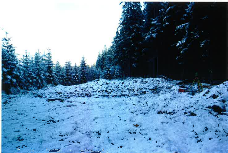
Fig. 1. Stensättningen vid Nyarpssjön klädd i vinterskrud.