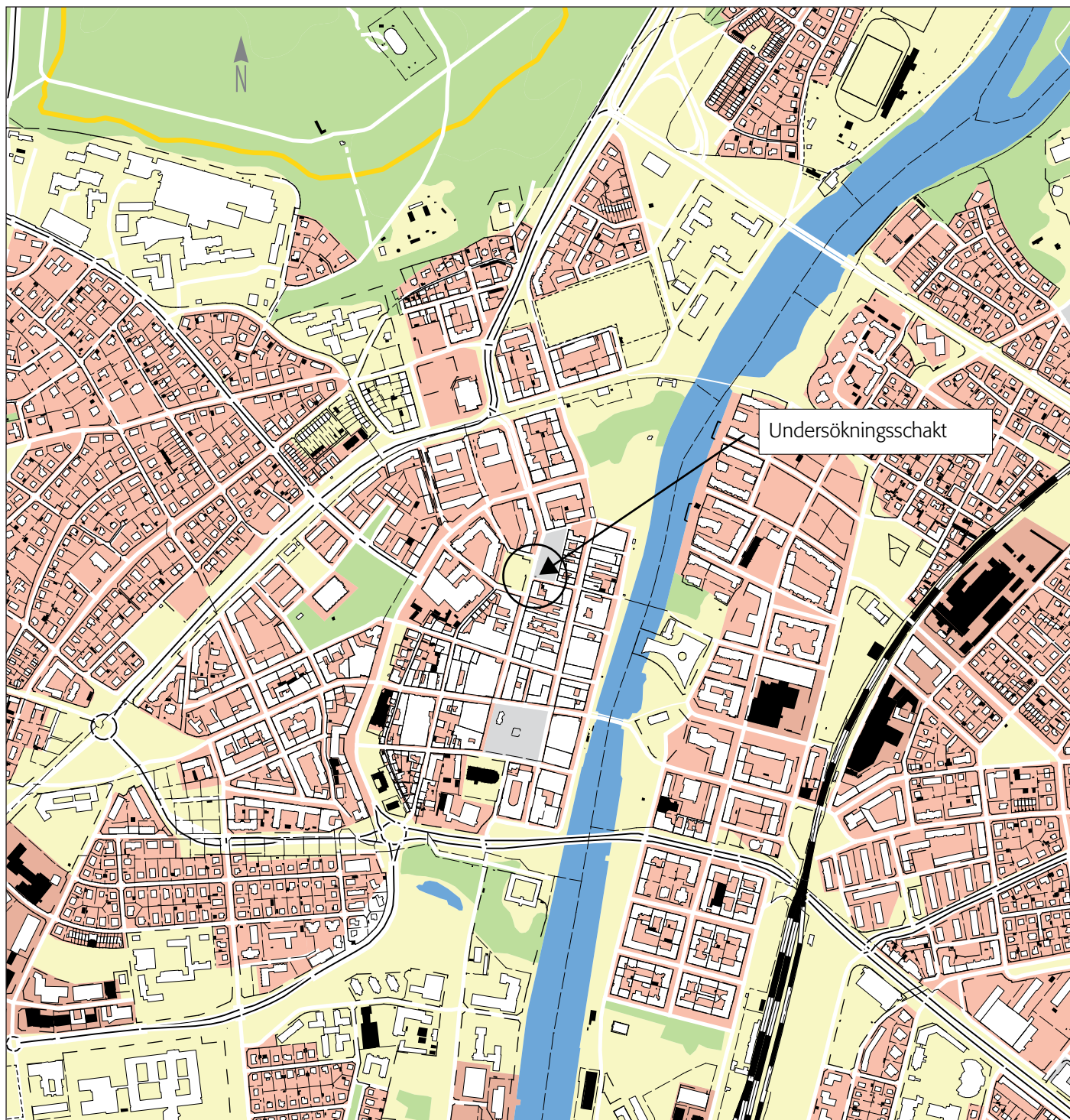
Fig. 1 Utdrag ur fastighetskartan med platsen för undersökningschaktet markerad. Skala 1:10 000.