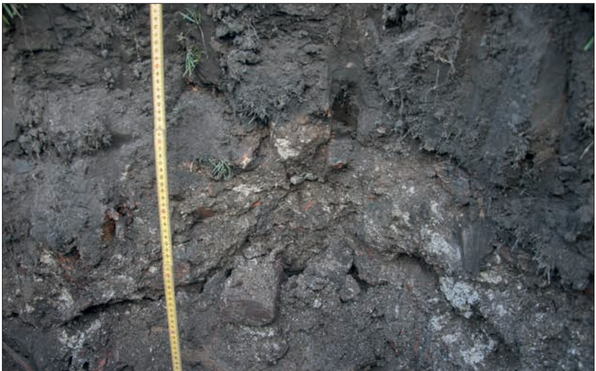
Fig. 4. Norra och östra profilen, schakt 6. Raseringsmaterial från kyrkogårdsmuren.