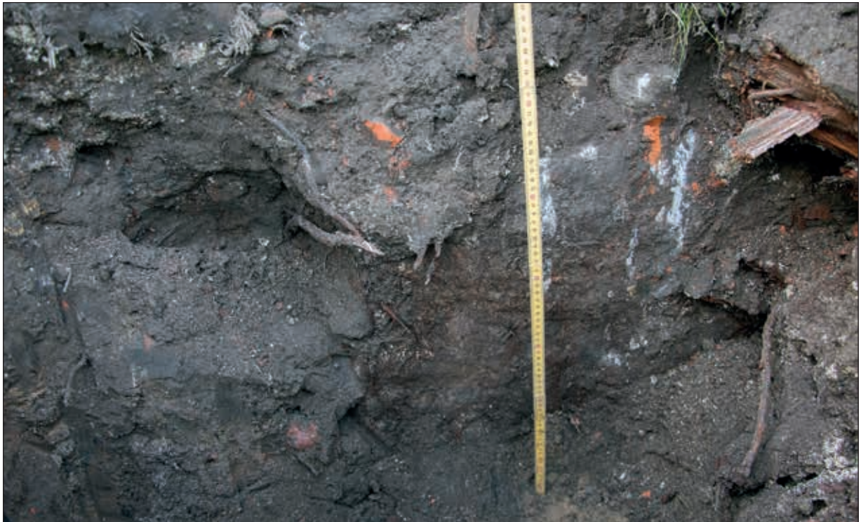
Fig 3. Västra profilen, schakt 5. Raseringssten från kyrkogårdsmuren. (Fotonr. 2015-52-3).