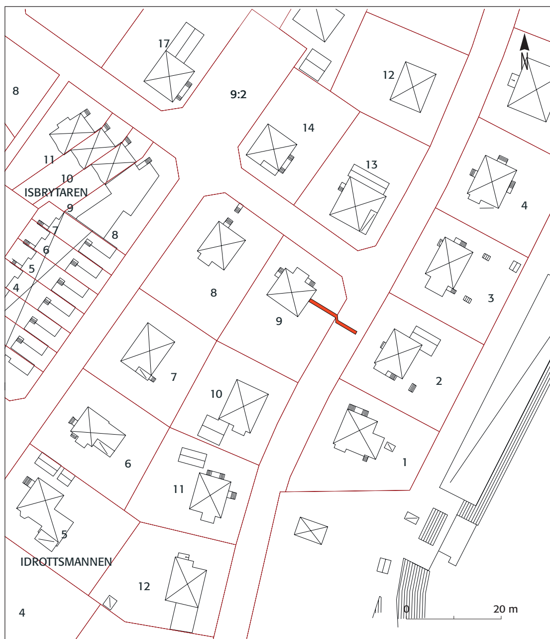
Figur 2. Kvarteret Idrottsmannen 9 med fjärrvärmeschakt markerat. Skala 1:800.

Vid schaktningsövervakningen grävdes ett schakt från fastighetens byggnad, genom gräsmattan och ut på Wallbergsgatan. Schaktet grävdes ned till naturlig sandbotten och inga arkeologiska lämningar påträffades. Inga fortsatta antikvariska insatser förordas.