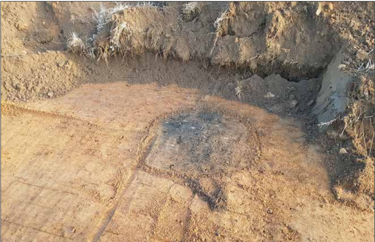
Figur 3. Härden AH577 i schaktet OS588. Mot syd. (Fotonr. 2019-76-4).

I den västra delen av undersökningsområdet är markmiljön genomgående blöt och vatten bubblar ställvis upp i marken, vilket gjorde att vissa delar av schakten fick läggas igen direkt. Försiktighet fick även iaktas så