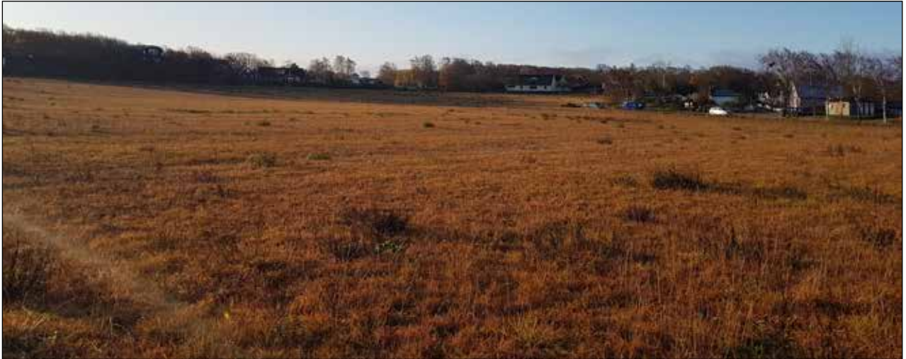
Figur 4. Undersökningsområdet innan schaktning. Mot syd. (Fotonr. 2019-76-1).

att inga dräneringar eller diken skadades. I det södra schaktet, OS588, var markmiljön olik den övriga ytan med en torrare sandig markmiljö. I detta schakt påträffades en härd, AH577, samt ett stolphål, AS568. Båda anläggningarna var av förhistorisk karaktär.