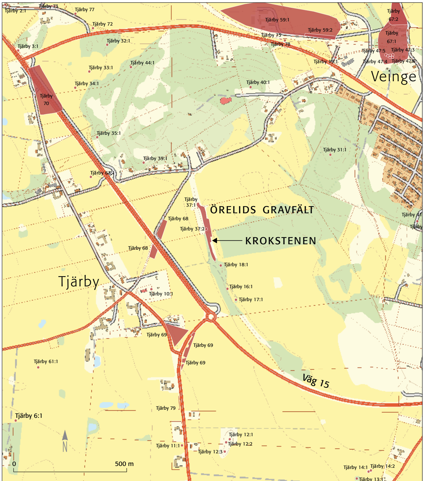
Figur 1: Örelids gravfält markerat på fastighetskartan tillsammans med övriga kända fornlämningar i området. Skala 1: 10 000.