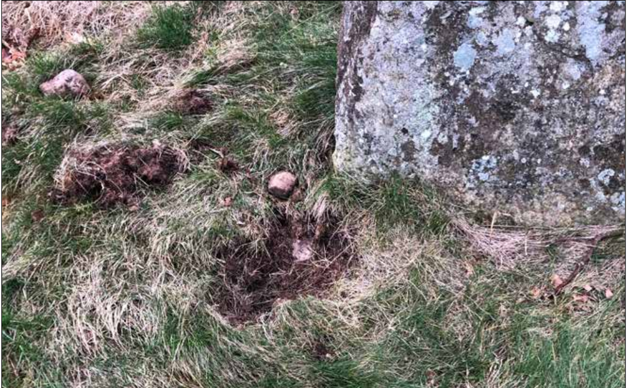
Figur 6: Mindre grop intill rest sten, framför vilken en plundringgrop påträffades 2016. (Fotonr: 2020-06-4).