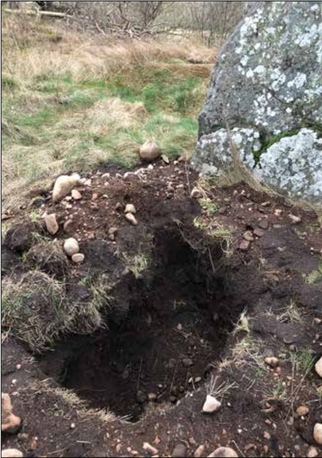
Figur 3: Plundringsgropen sedd från nordöst. (Fotonr: 2020-06-2).