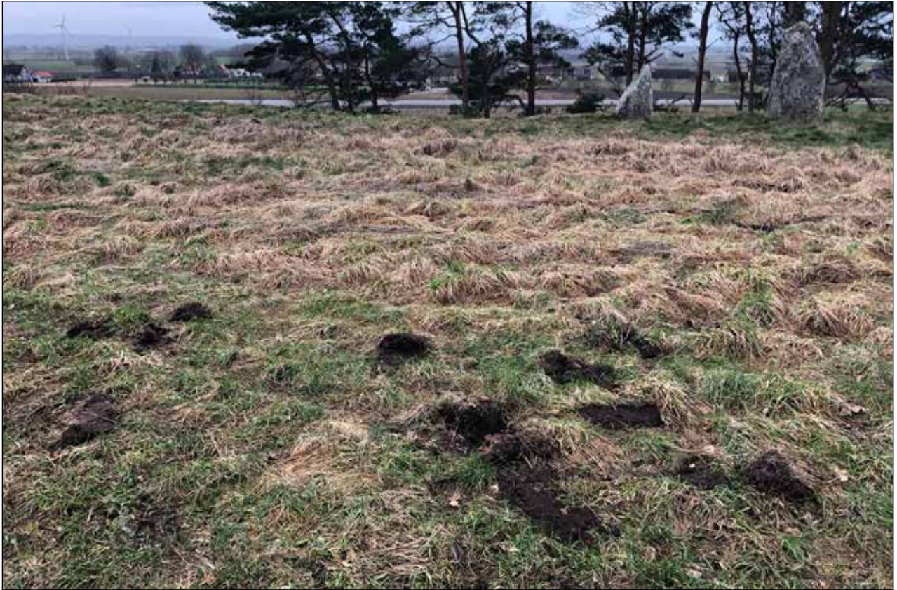
Figur 5: Spadstick inom gravfältets centrala del. Mot väst. (Fotonr: 2020-06-5).