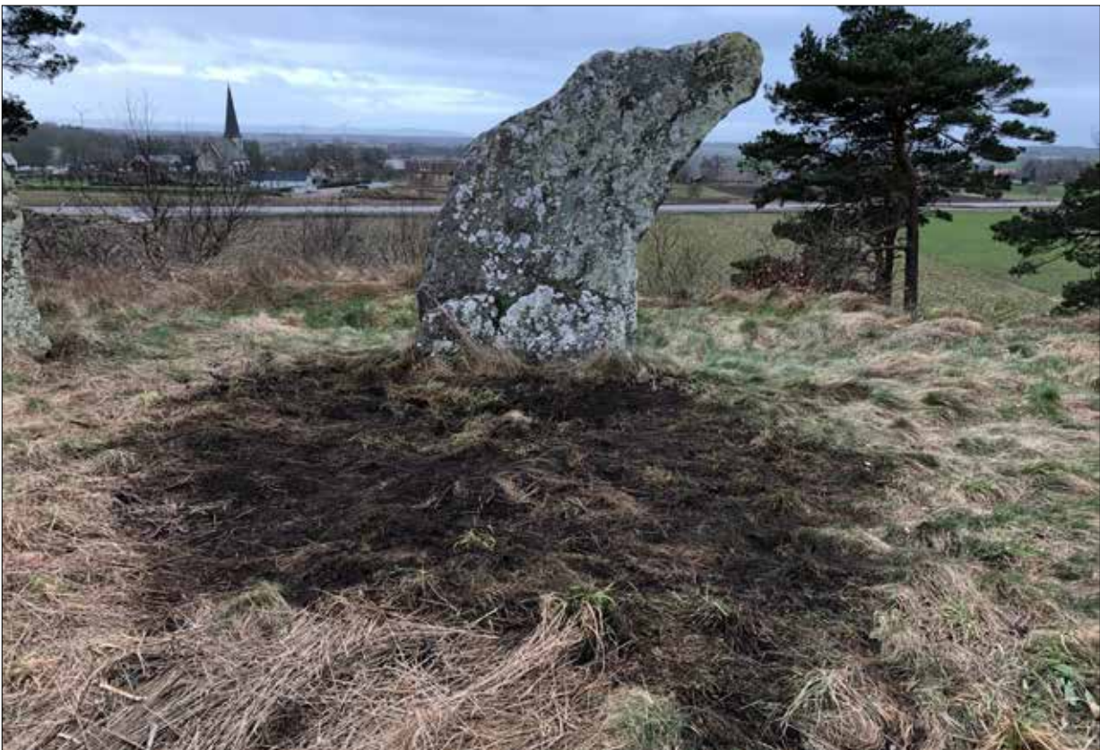
Figur 4: Plundringsgropen efter återställning. Mot väst. (Fotonr: 2020-06-3).