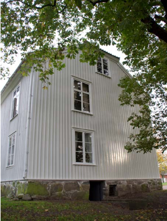
Foto efter renovering