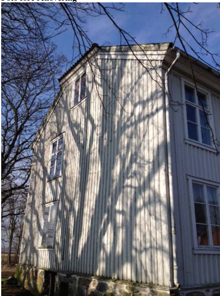
Foto före renovering

Fasaden var något svårfotograferad pga skuggverkan, men bilden visar tydligt hur droppisen i nederkanten var missfärgad och vittrad.