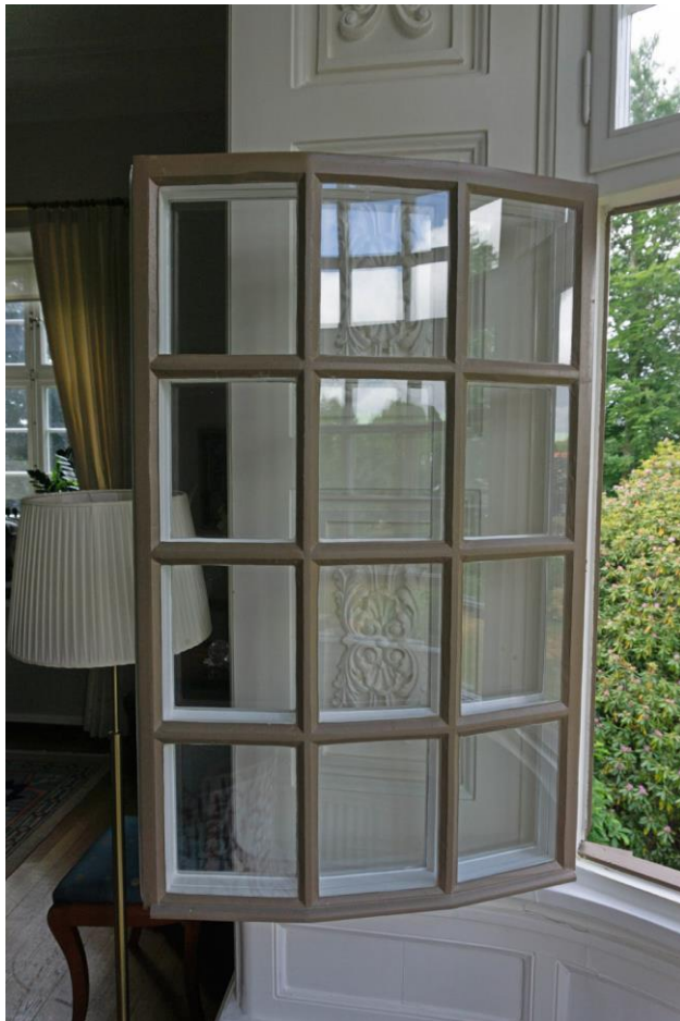
Fönstren i karnapet före (ovan) och efter renovering (tv)