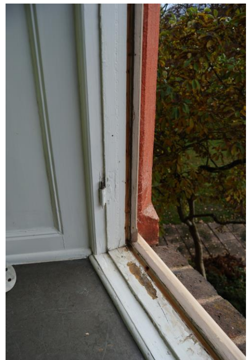
Avrinningsränna i karmen rensades.