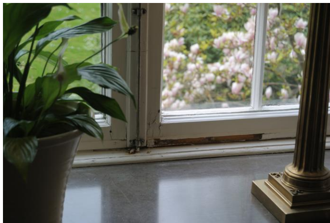
Läckage mellan karm och båg orsakade återkommande skador med tillkommande underhållsåtgärder.