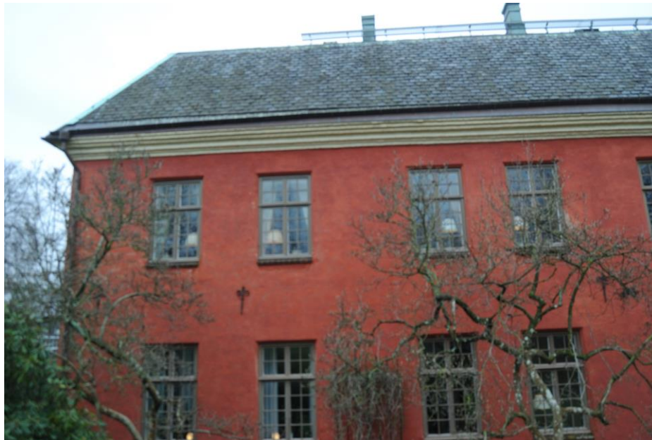
Södra längan, fasaden mot söder med de fyra fönster på andra våningen som renoverats.