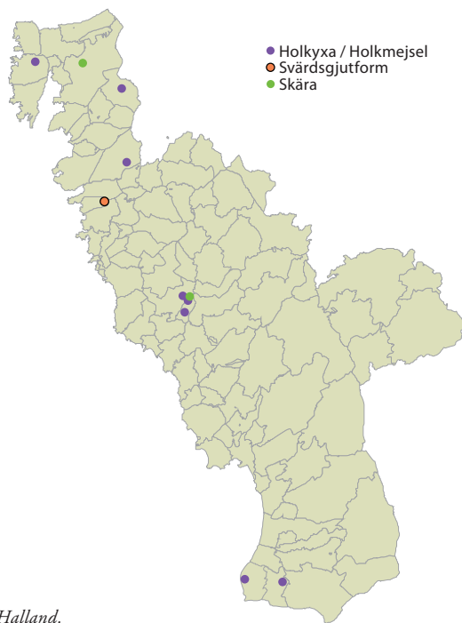
2. Fyndplatser för täljstensgjutformar i Halland.

svärdsgjutformen till en av de äldsta gjutformarna i Sverige.