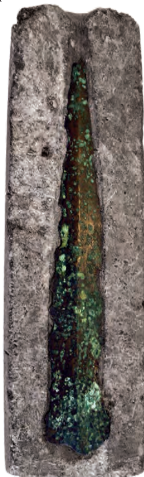
Fig 5. Passformen mellan gjutformen och klingan från Östra Karup är såpass god att det är rimligt att tro att klingan antingen är gjuten i formen eller i en form som haft Torpaformen som förlaga.

har också slipats, framförallt mot den spetsiga sidan. Trots detta måste sägas att klingan passar väldigt bra i formen. Måtten vid fästet på klingan överensstämmer mot gjutformen. Likaså följer den avsmalnande formen i det närmaste perfekt mot gjutkaviteten. Det är mycket sannolikt att klingan från Östra Karup är antingen gjuten i eller tillverkad utifrån en förlaga som gjutits i formen från Torpa. Naturligtvis skulle det vara mycket intressant att vidga studien till att omfatta fler klingor. Detta skulle kunna ge en mycket intressant inblick i distributionsmönster och kontaktytor under den tidiga delen av bronsåldern. Att klingorna är tillverkade i Skandinavien gör inte saken mindre intressant och frågan är i vilken riktning distributionen av klingor egentligen har tagit. Framtida studier får bringa klarhet i detta, men det är tillfredställande att konstatera att det går att finna en direkt länk mellan produktion (gjutformen) och bruk (klingan) från en tid som är så pass avlägsen som den äldre bronsåldern. ✎