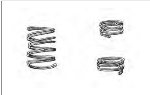
5. Guldringar från gravarna 516 i Karlslunde (A) (efter Aner & Kersten 1973: Tafel 108) och grav 578 Vester-Såby (B) (efter Aner & Kersten 1973: Tafel 120) från København amt.