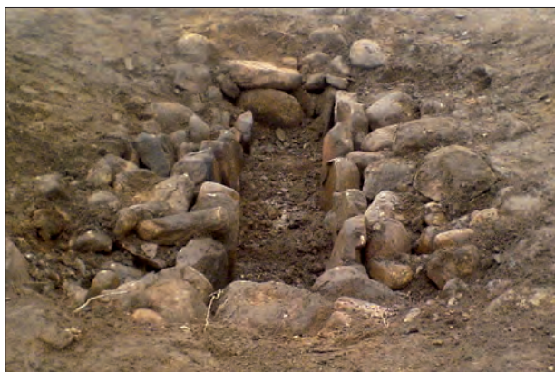
2. Stenkistan i Tackhöj i Ränneslöv.