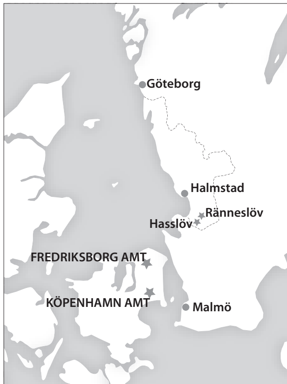
1. Översikt över de platser med gravhögar som nämns i artikeln, markerade med en stjärna.

som den nyligen undersökta stenkistan i Ränneslöv. Artikeln syftar därmed inte till en problematisering kring exempelvis människans handlingar vid anläggandet av gravmonumentet.