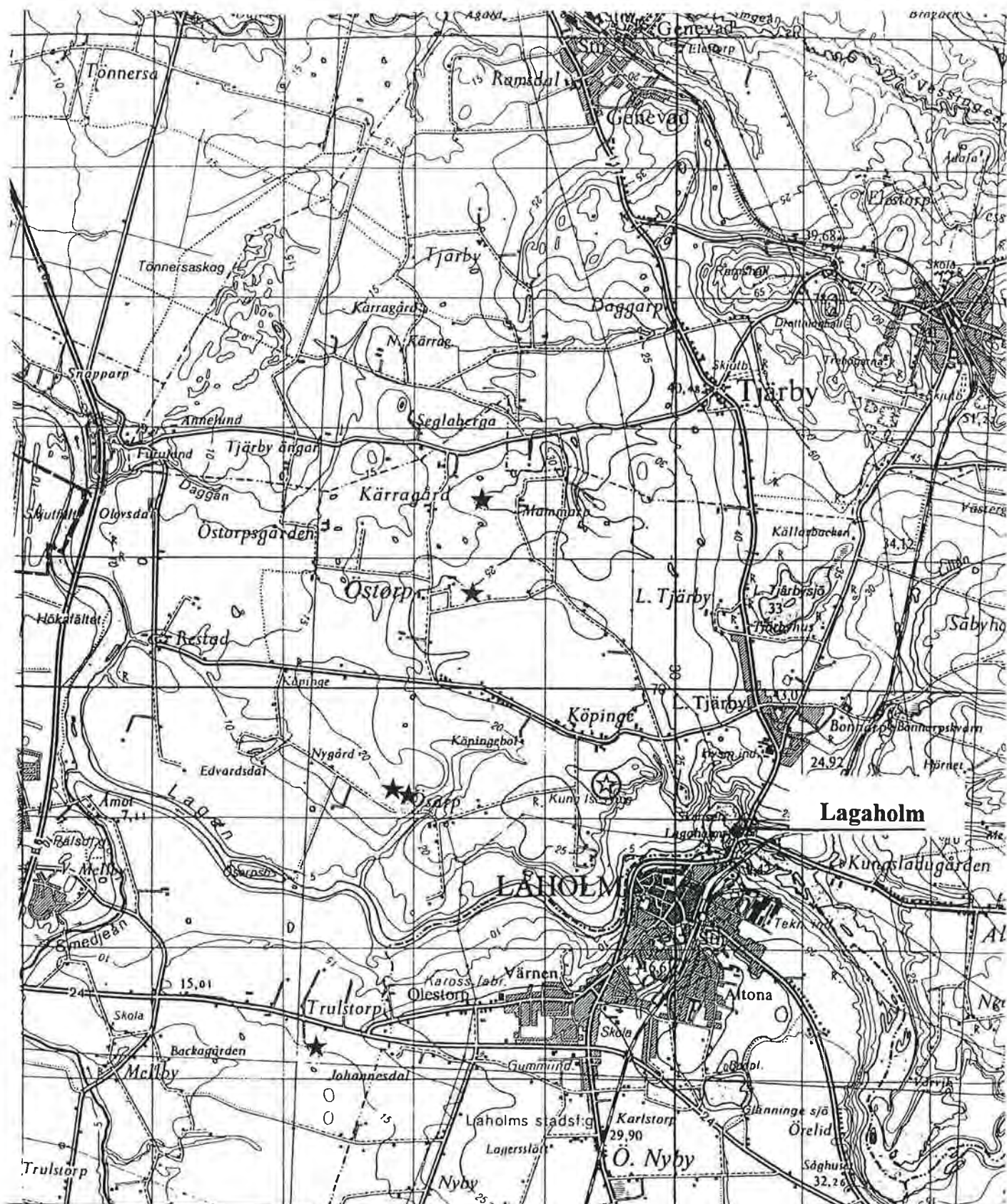
Figur 1. Topografisk översiktskarta samtliga diskuterade platser markerade. Boplatsmarkeringar från norr till söder: Kärragård, Östorp, Ösarp, Ösarp och Trulstorp. Köpinge markerat med cirkel och begravningsplatsen vid Lagaholm.