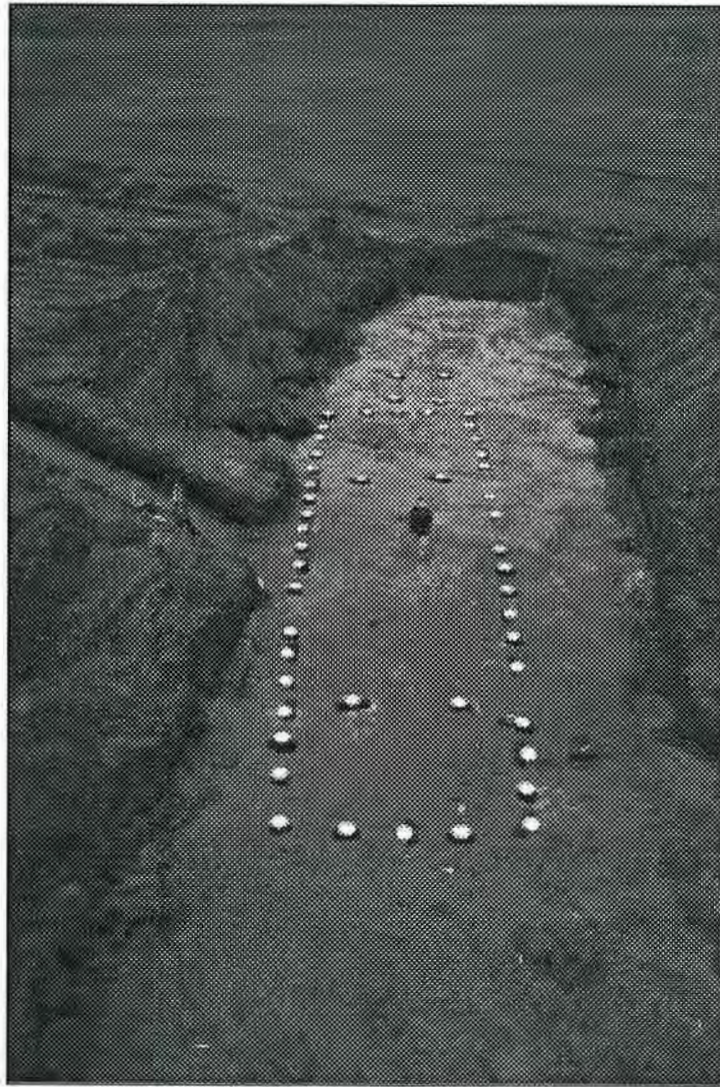
Figur 2. Trelleborgshuset sett från väst. Notera den centralt belägna hallen, samt avsaknaden av yttre snedsträvor.

undersöktes en större bopplats med lämningar allt ifrån neolitikum till tidigmedeltid. På områdets högsta krönläge låg ett 21,5 m långt Trelleborgshus som C 14 -daterades till perioden 1050-1250, dvs sen vikingatid - tidigmedeltid. Huset dominerades av en centralt belägen, 12 m lång hall och de konvexa ytterväggarna stöttades av yttre snedsträvor. Vid husets västra långsida låg ett uthus, vinklat 90 grader från huvudbyggnaden och eventuellt har även ett tredje hus ingått i gårds-komplexet. Den sista påvisbara bosättningen på undersökningsytan utgörs av husbebyggelse daterad till 1200-talet, belägen omedelbart söder om krönläget (Wattman 1996).