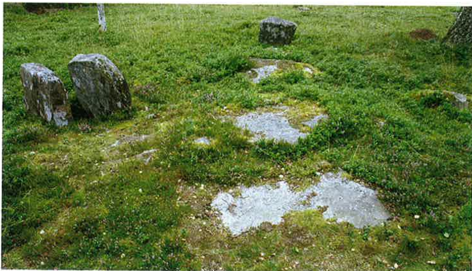
Fig. 5. Framför de kantställda sidohällarna ligger fortfarande takhällarna kvar.