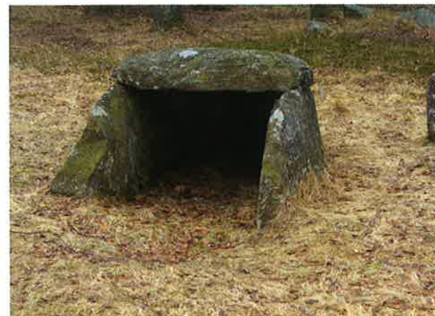
Fig. 1. Den restaurerade järnåldersdösen på Vrenningegravfältet kan illustrera gravarnas ursprungliga form och utseende.

Bland de helt intakta gravarna står det klart att man huvudsakligen eftersträvat en något så när enhetlig placering av dösarna med ingången eller den öppna sidan placerad mer eller mindre åt söder (Nordman, 1997: 125). På Vrenningegravfältet är däremot öppningen riktad mot norr men här kan mycket väl den mänskliga faktorn ha varit helt avgörande. När gravfältet restaurerades kring mitten av 1920-talet fanns det endast två stenar kvar på ursprunglig plats, de båda sidohällarna. Enligt uppgift från lokalbefolkningen skulle de två andra hållarna ligga i en bro ett par hundra meter från gravfältet. Efter att ha granskat de stenar som fanns i bron tyckte man sig kunna urskilja två stycken som borde ha ingått i dösen. När dessa återfördes till sin ursprungliga plats kan det ha skett en förväxling och gavelhällen placerats i "fel" ända av monumentet med öppningen riktad mot en intilliggande treudd (fig. 1).