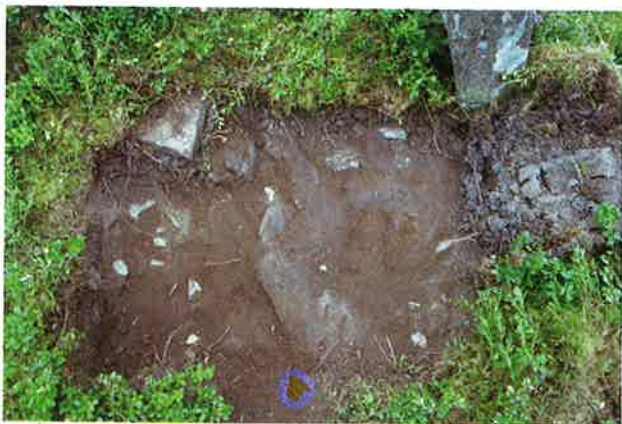
Fig. 4. Den borttagna gavelhällen har ursprungligen varit ställd på en väl lagd stenpackning. Insprängt mellan stenarna fanns ett stort antal kvartsbitar.

Trots de små ingrepp som gjorde vid undersökningen ger resultaten tydliga belegg för ett mer differentierat gravskick där järnåldersdösen endast är en av flera gravmarkeringar ovan mark. Kanske är det så att de solitära hållarna är den gravmarkering som utgör majoriteten medan dösarna liksom de enstaka domarringarna har fått stå i fokus men trots allt är i minoritet inom gravfältet.