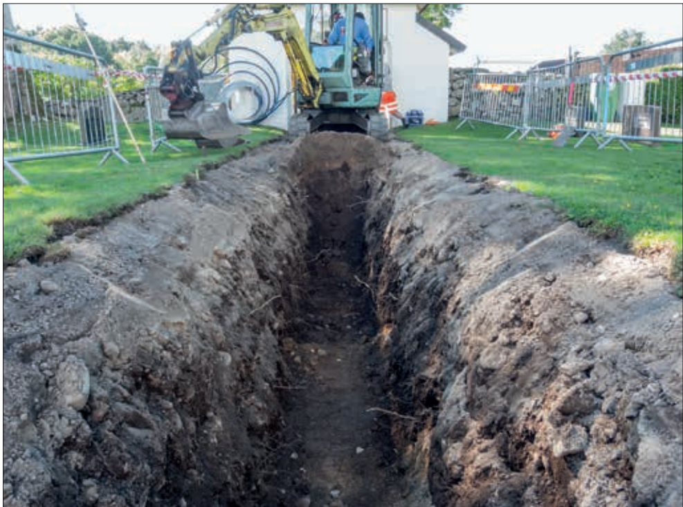
Fig. 7. Schakt med nedgrävningar för gravar, söder om kyrkan i den befintliga grusgången. Mot S Fotonr: 2015-43-22.