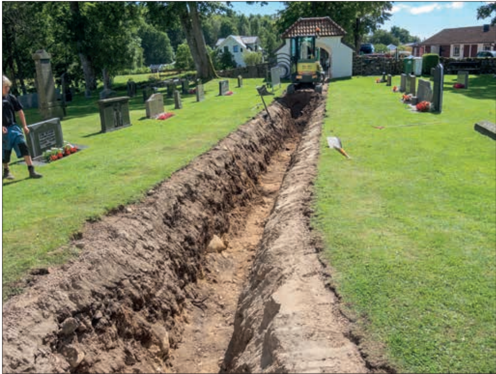
Fig. 6. Schakt 2 söder om kyrkan i den befintliga grusgången. Nedgrävningar för gravar syns i hela schaktet. Mot S. Fotonr 2015-43-19.