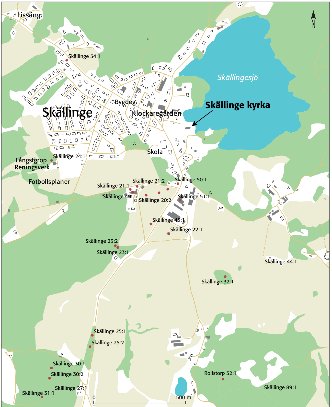
Fig. 1. Skällinge kyrka med omgivande fornlämningar. Skala 1:10 000.