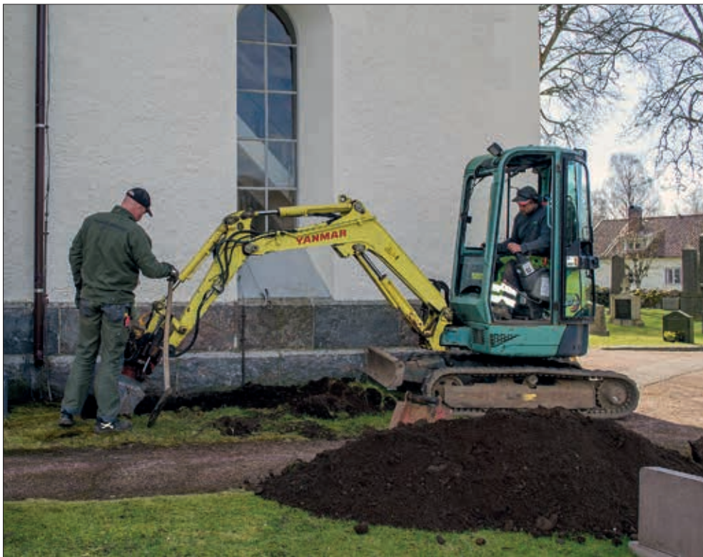
Fig.3. Schaktning för schakt 1 på norrsidan av kyrkan. Mot S Fotonr:2015-43-9.

Schaktningsövervakningen har genomförts vid två skilda tillfällen. Vid det första, den 9 april 2015 grävdes två schakt, på vardera norra samt södra sidan av kyrkobyggnaden i den västra delen av byggnaden. Schakt 1 grävdes norr om kyrktornet. Det 1,6 meter breda i nordsydlig riktning och 2,2 meter långa schaktet i östvästlig riktning var 0,8 meter djupt. Under det översta partiet med 0,06 meter tjock mossa framkom ett 0,15 meter tjockt lager med brun lerig humös finkornig matjord som var torr och kompakt till karaktären, med inslag av träkolskoncen-