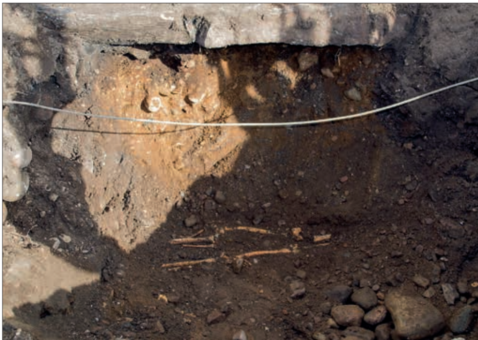
Fig. 5. Skelettgrav påträffades på ett djup av 1,25 från schaktkant. Mot N. Fotonr: 2015-43-5.