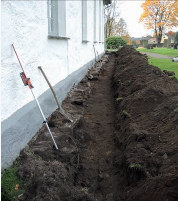
Figur 4. Schaktet norr om kyrkan mot V. Fotonr: 2016-60-3