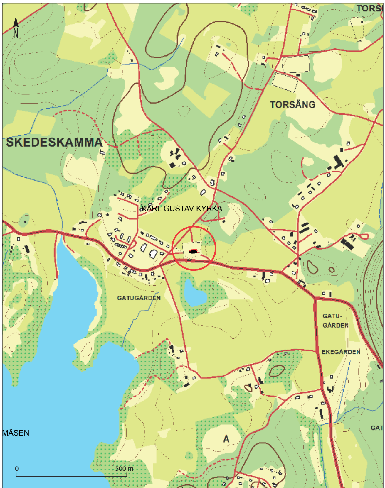
Figur 1. Fastighetskarta med Karl Gustav kyrka inringad. Skala 1:10 000.