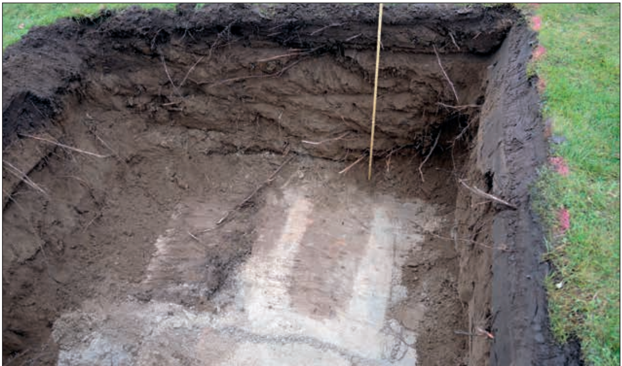
Figur 6. Schakt för stenkista. Nedgrävningar för gravar i botten av schaktet på 1,4 meters djup. Mot Ö. Fotonr: 2016-60-16