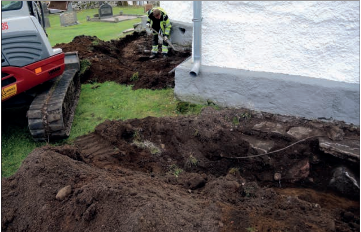
Figur 5. Östligaste änden av schaktet norr om kyrkan. Schaktet längs östra absiden syns i bakgrunden. Mot SO. Fotonr: 2016-60-8