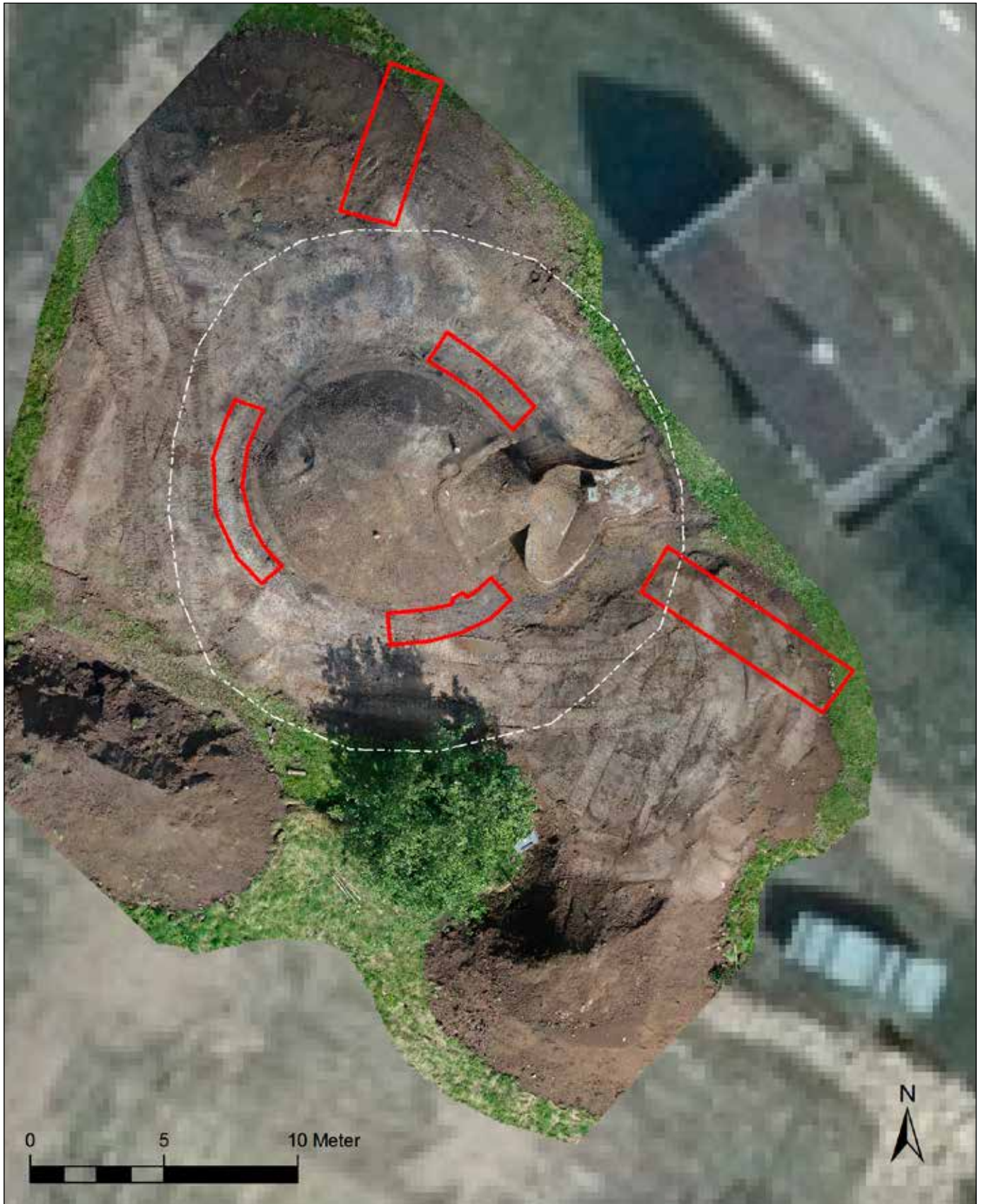
Koordinatsatt ortofoto av den framrensade betongkonstruktionen, med tidigare högens omkrets i vitt och schakten från den antikvariska kontrollen i rött. Skala 1:200.