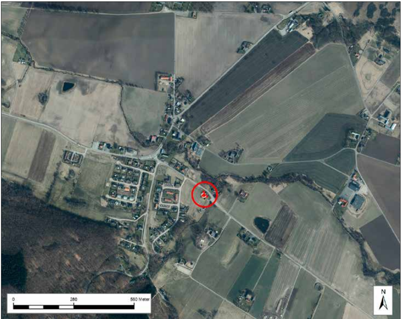
Fig. 1. Karta 1:10 000 visandes undersökningsområde.