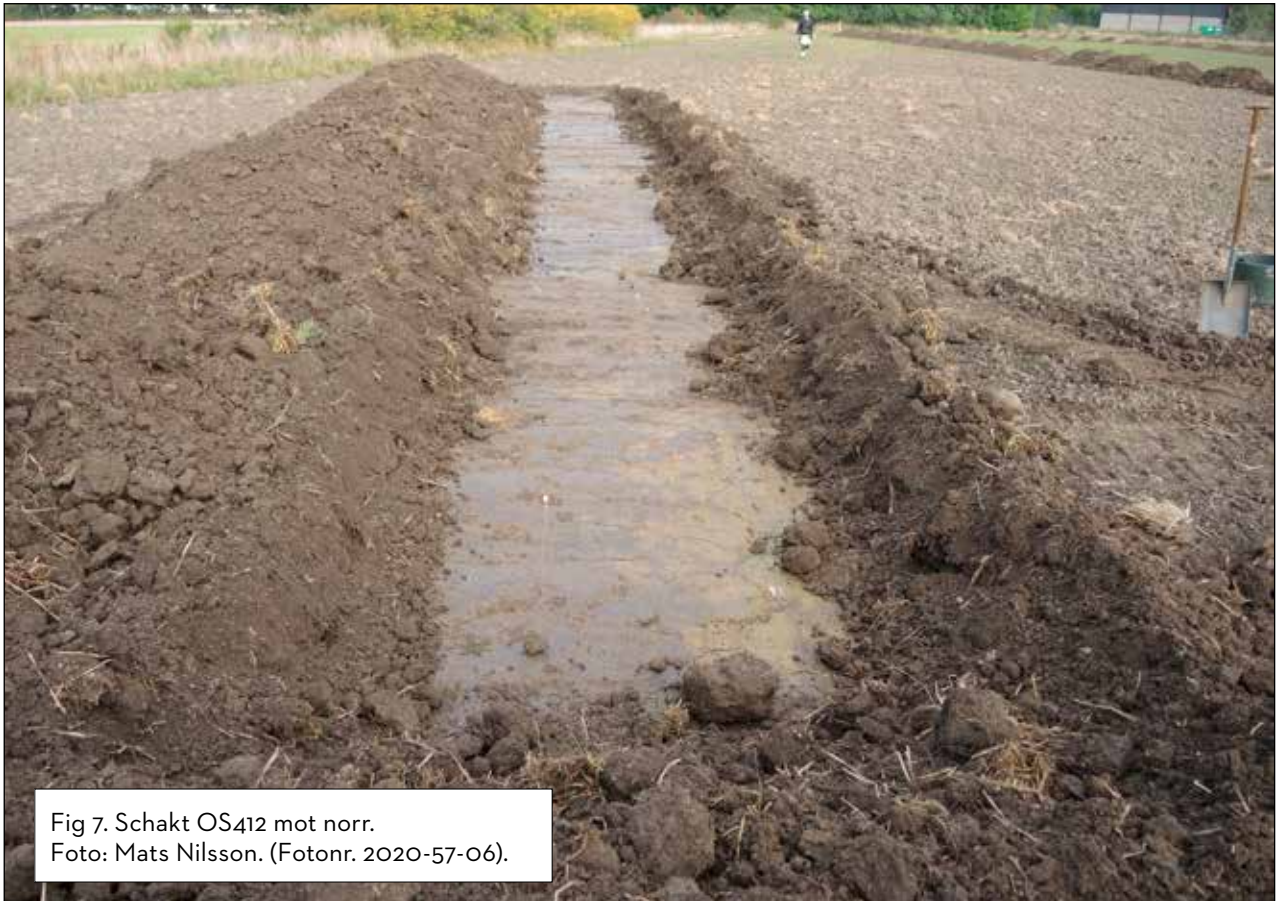
Fig 7. Schakt OS412 mot norr. (Fotonr. 2020-57-06).