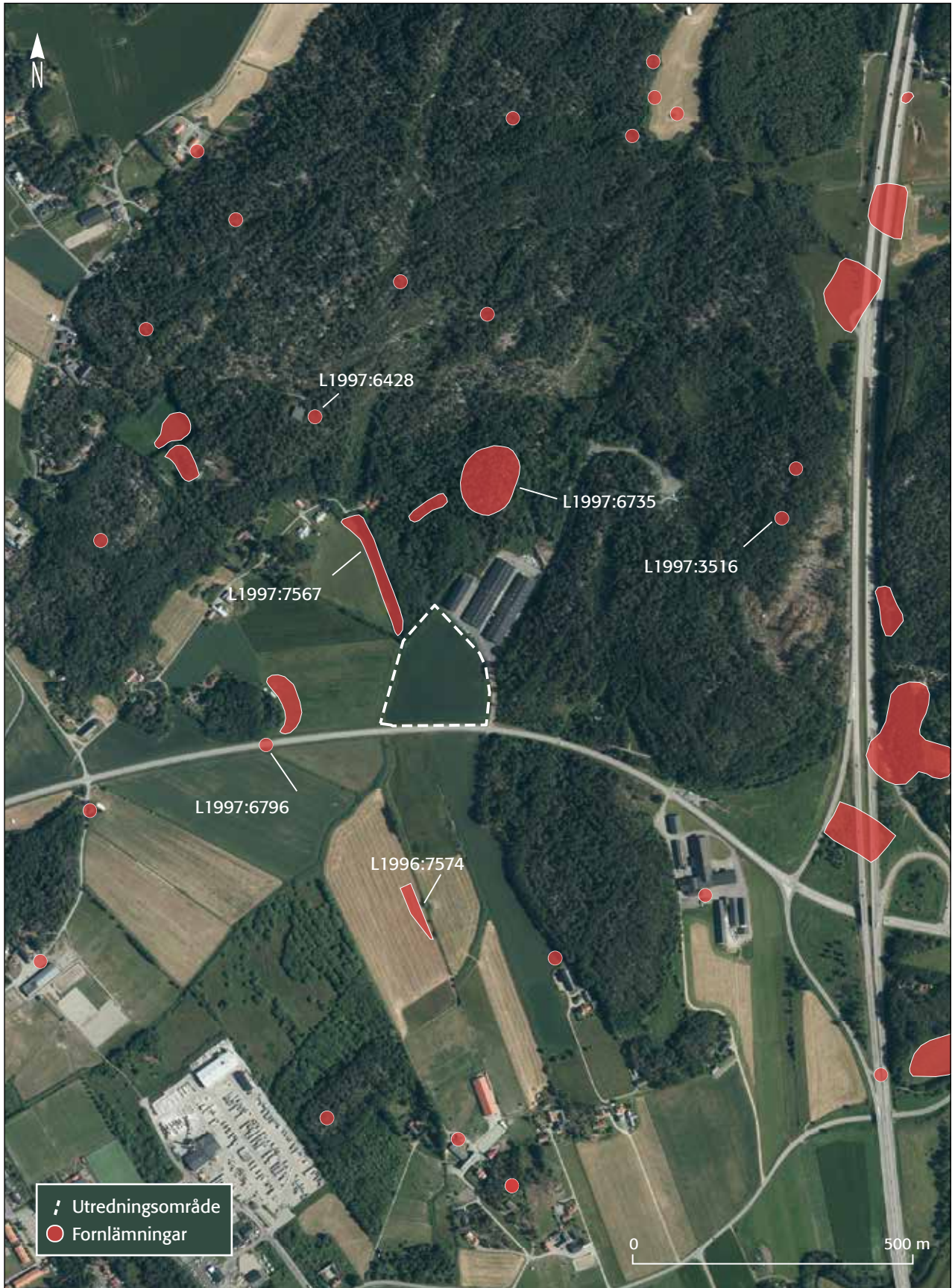
Figur 1. Översiktskarta för utredningsområdet på fastigheten Frillesås-Rya 4:17. Skala 1:10 000.