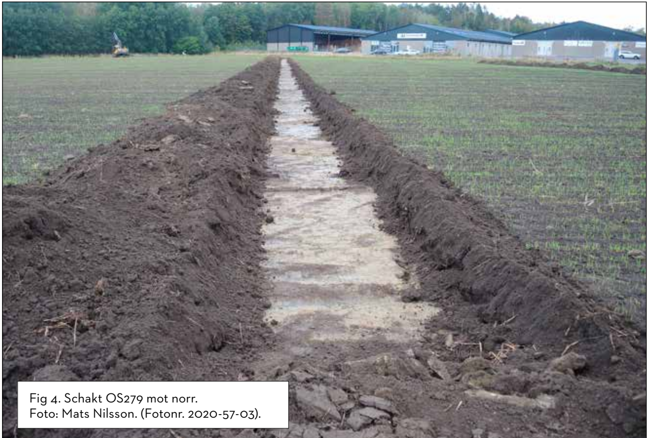
Fig 4. Schakt OS279 mot norr. (Fotonr. 2020-57-03).