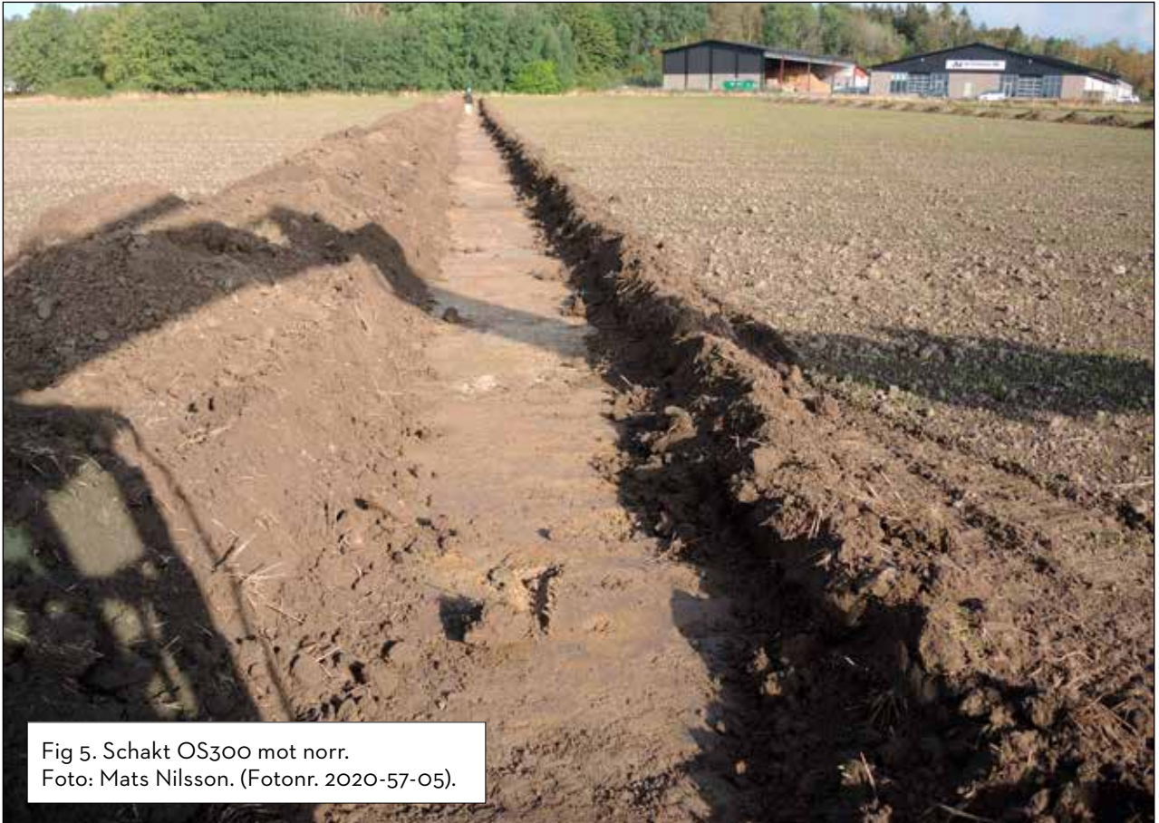
Fig 5. Schakt OS300 mot norr. (Fotonr. 2020-57-05).