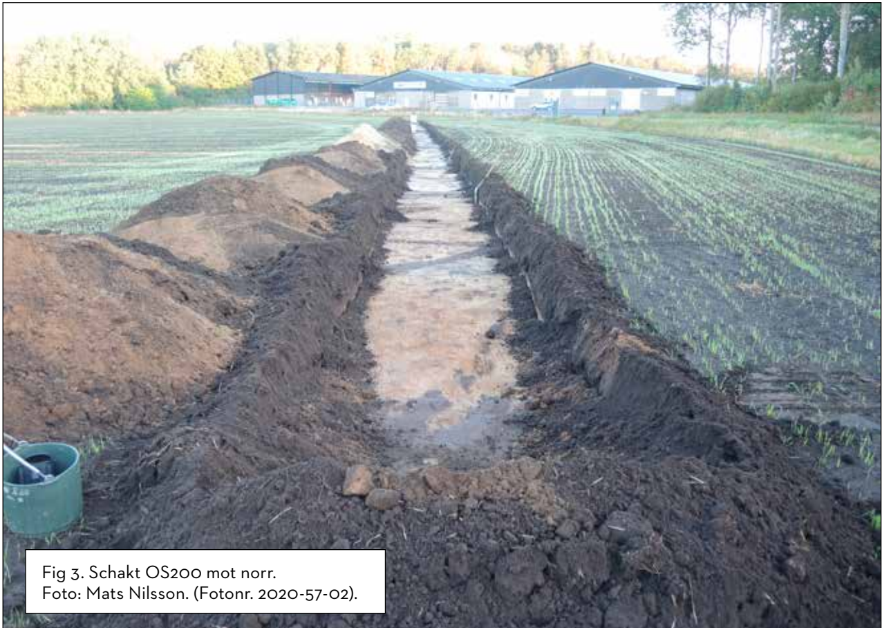
Fig 3. Schakt OS200 mot norr. (Fotonr. 2020-57-02).