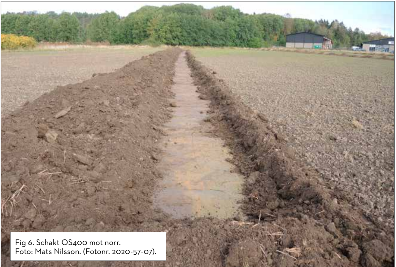
Fig 6. Schakt OS400 mot norr. (Fotonr. 2020-57-07).